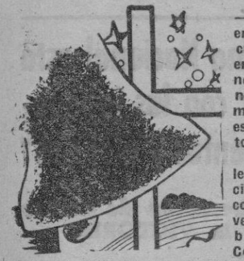
...bía prescindido de mí en absoluto. Mi presencia le traía sin cuidado absorto ante tanta maravilla.

Granada es peligrosa. Muchos que llegaron a ella como turistas, esto es de paso, no tuvieron fuerzas para abandonararla. La tomaron como tránsito y fué para ellos destino.