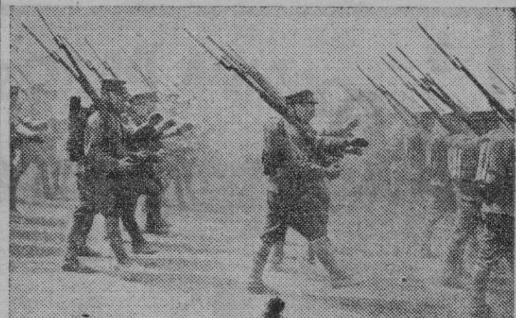
Infantería nipona desfila ante el Emperador.

Este diario es en cierta forma el punto de partida del gran Japón actual. A mediados del siglo XIX un americano, el co-