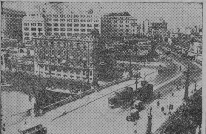
Una de las calles principales del moderno Tokio.