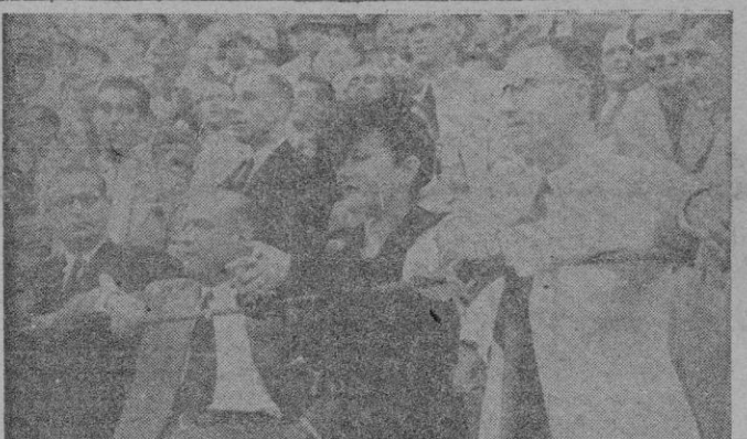
Nuestro Gobernador Civil y Jefe Provincial, es un admirador de la fiesta nacional. Desde su barrera, acompañado de su esposa, presenció la corrida del domingo, confundido con la multitud

Camaradas: Para que se abran los ojos de todos a nuestra luz, para que bendiga el sacrificio de los nuestros y los hagan florecer, para que dé a nuestras banderas victoriosas y a nuestros hombres la fe, para que nos ayude a levantarnos tantas veces como caemos en la vida, para que sepamos perdonar cuando él nos mande perdonar y dé acierto al que manda y a los que obedecemos, por el alma del camarada que alcanzó gloria cuando perdió vida, vamos a rezar de pie como los soldados en asalto, un padrenuestro.» — Cifra.