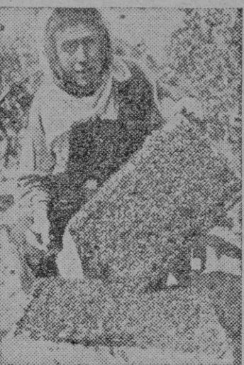
El apicultor saca el cuadro de una colmena

Que pasa pues cuando un enjambre pierde a su reina? Apenas ha cundido la voz del desgraciado accidente por todos los ámbitos del desolado reino, cuando cesan de repente los trabajos ordinarios de aquellos activísimos talleres. Suspendese la fabricación de panales, se interrumpe el aprovisionamiento de la miel, no se piensa en las obras de pública limpieza; un solo pensamiento preocupa a la población entera: proveerse de nueva reina. Pasadas unas horas aparecen en casi todos los panales unas nuevas y raras construcciones enteramente distintas de las ordinarias. Alarganse de una manera irregular aca y alla ciertas celditas mayores que todas las otras, y de forma peculiar muy semejantes a los dedalitos, en donde encaja la cabeza de las bellotas. Son las llamadas «celdas reales» las cunas en donde han de ser nacidas y como ama-