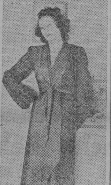
Para estar por casa nada tan cómodo y práctico como este sencillo batín de línea casi masculina. El cinturón anudado, pende en dos grandes, caídas sin lazo. La manga se frunce en un puño ajustado a la muñeca.

Luego se sumergen los objetos en agua fría. Se secan con sumo cuidado y se ponen por fin al sol o al amor de la lumbre, hasta que queden bien secos.