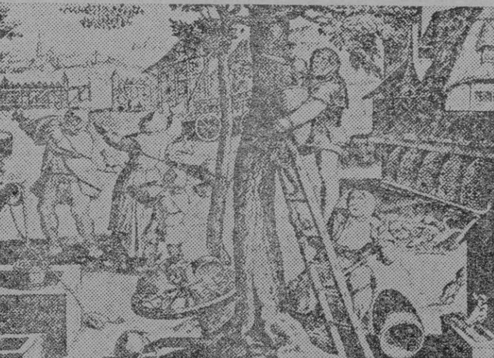
Un curioso grabado sobre la apicultura en Alemania en el siglo XVI

cinco a treinta mil obreras, abejas estériles, que son los operarios, soldados, vigilantes, el todo de la colmena; y de seiscientos a mil zanganos cuya función no está aun bien defi-