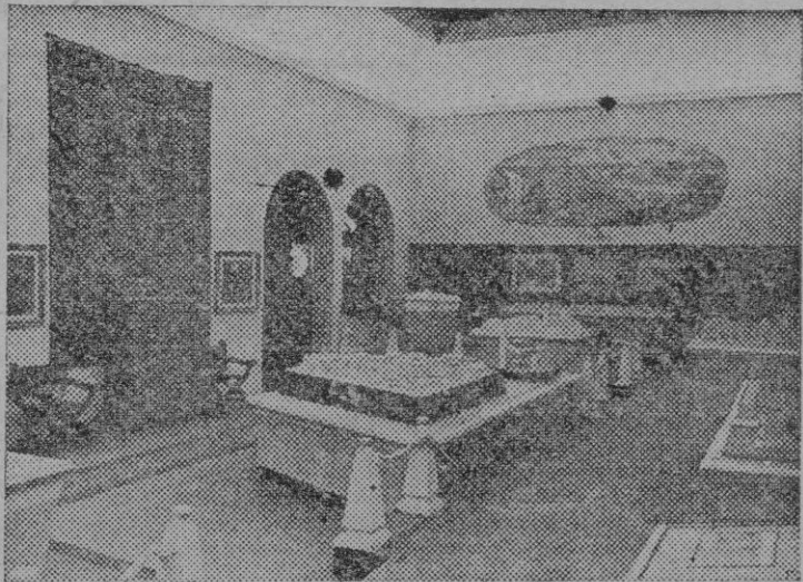
Una perspectiva de la instalación del Servicio de Regiones Devastadas en la XX FERIA MUESTRARIO INTERNACIONAL DE VALENCIA. En ella pueden apreciarse dentro de la norma austera que preside todas las manifestaciones del Estado Nacionalista, un sentido artístico cuidadosísimo del conjunto y la completa visión de lo que serán los trabajos proyectados, fielmente reflejados en las maquetas