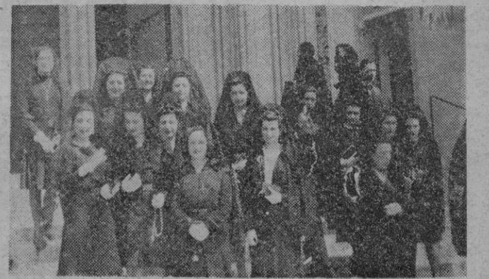
Este año con más profusión que nunca, nuestras calles y templos han ofrecido el espectáculo español y hermosísimo de la mujer ataviada con la clásica mantilla. — A la salida de Santa Eulalia nuestro reportero gráfico captó este grupo.