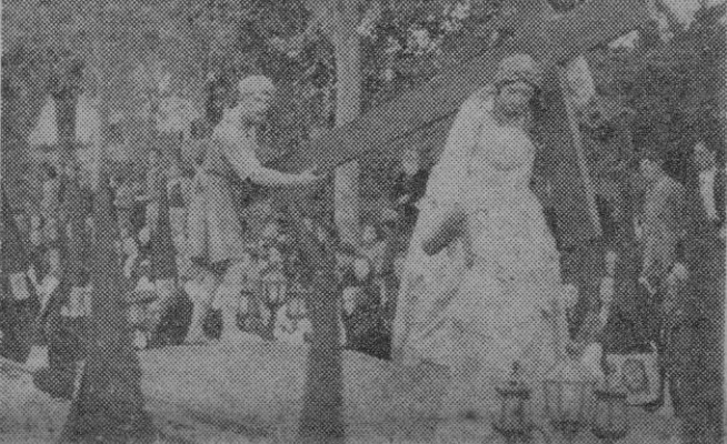
Uno de los «pasos» de la solemne procesión del Jueves Santo.