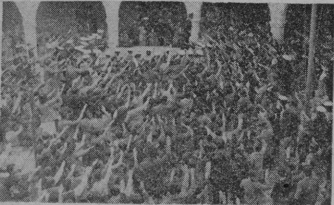
En el maravilloso escenario del Patio del Castillo de Bellver, nuestros camaradas del Frente de Juventudes celebran el «Día de la Canción».