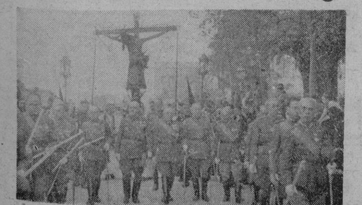
Entre el fervor de la multitud, el Santo Cristo de la Sangre recorrió las calles de Palma. — Representaciones militares, acompañan a la Preciosísima Imagen