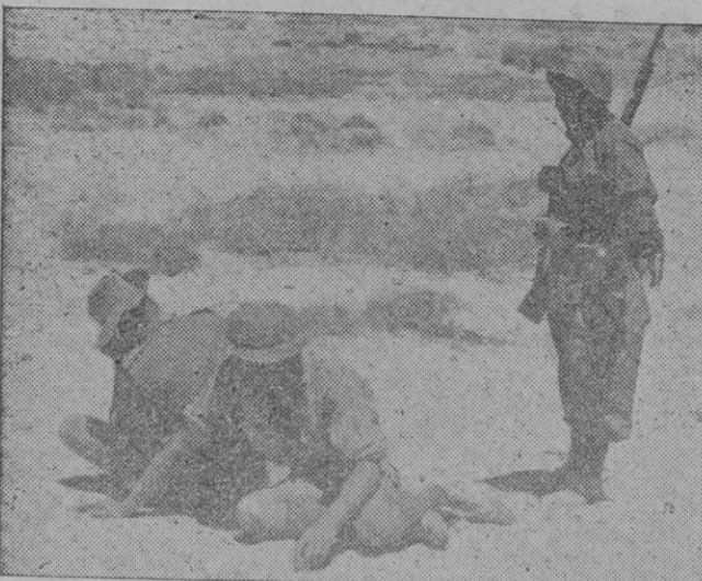
Sobre la caldeada arena de Africa acampan estos dos prisioneros ingleses capturados por las tropas italianas. El casco de uno y el sombrero del otro hablan de las dos razas que —entre otras— defienden al Gobierno de S. M... rendidas ante la mirada bondadosa de un soldado fascista