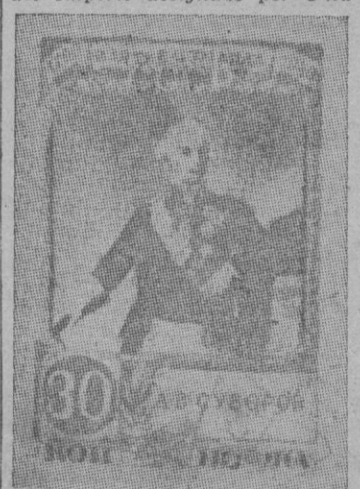
Una II y luego Comandante General del Ejército del Czar Pablo I en 1799. Exaltación que demuestra la mentalidad ambigua y la megalomanía del despota rojo, el cual después de haber intentado destruir todo recuerdo del pasado, quisiera ahora atenuar sus consecuencias restaurando viejos inocos, incluso la autoridad religiosa de los Papas de las viejas creencias, y se dedica incluso, a exponer a la vista de un pueblo huérfano de ideales, substituyendo la hoz y el martillo las efigies de aquellos que en la Rusia zarista, representaban la invasión del occidente europeo, en especial después de la guerra de siete años culminada con la ocupación de Prusia y de Berlín, como consecuencia de la victoria de Kunersdorf.

La reproducción del retrato del General en algo que tanta difusión tiene como un sello hace suponer que al recordar Stalin el 150 aniversario de la victoria obtenida por aquel sobre los turcos en Turtukai en 1771, siente por el difunto Príncipe admiración porque recuerda seguramente que fué el propio Mariscal quien dominó la insurrección del Cáucaso, la de Besarabia y la de Polonia, y llevó su poderoso Ejército en el valle del Po, batiendo a los franceses en Cassano y ocupando el Piemonte.