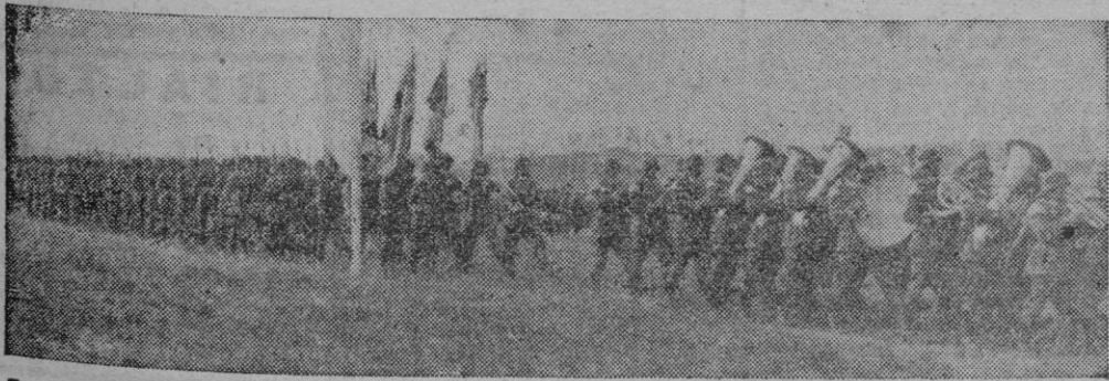
En esta reciente fotografía de la División Azul, en su campamento de un lugar de Alemania, vemos desfilar a nuestros camaradas en el acto de la Jura de la bandera