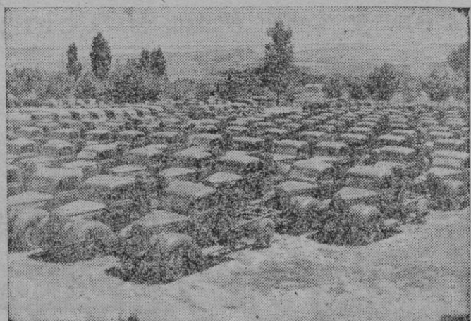
Numerosos camiones del Ejército preparados para funcionar con gasógenos

Granada. — Han comenzado las obras de mejora del ferrocarril eléctrico a Sierra Nevada, consistentes en prolongar la línea actual en nueve kilómetros y medio, hasta las minas de La Estrella. Según comunica el Gobernador Civil, el Gobierno está interesado en realizar estas obras cuanto antes, no solamente por la importancia que para Granada tienen, sino también para el turismo y el deporte en general. El tendido actual tiene una longitud de 17 kilómetros, y llega hasta Maitena. Con la prolongación que se proyecta, el ferrocarril sube hasta una altura de 1.500 metros sobre el nivel del mar, en lugar de los 1.000 que ahora alcanza. Solamente en la explanación de vías correspondiente a la prolongación se emplearán dos millones de pesetas.