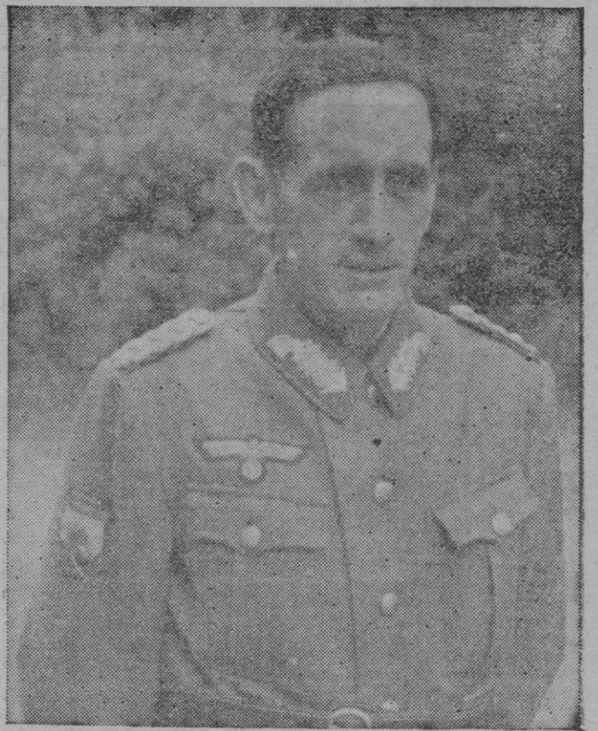
El General Muñoz Grande, Jefe de la División Azul, vistiendo el uniforme de campaña, y de quien publicamos unas interesantes declaraciones en la presente edición