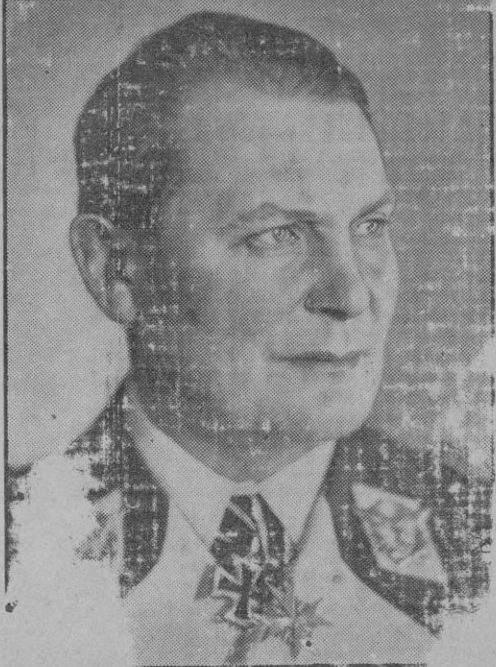
Hermann Goering, Mariscal de Alemania, creador de la formidable arma aérea del Reich. Goering ha sido también uno de los propulsores de la reconstrucción económica alemana, dirigiendo el famoso Plan Cuadrienal. Luchador Nacional-socialista y brazo derecho de Hitler, quien en su último y trascendental discurso en el Reichstag, exaltó su figura excepcional presentándolo como el primer ejecutor de la Victoria y entregándole, entre ovaciones delirantes, las insignias de la Gran Cruz de la Cruz de Hierro, concedida por primera vez.

En frente de este magnífico instrumento de guerra, nos encontramos con soldados imbuidos de las doctrinas disolventes del socialismo y del comunismo, en los que se ha matado, poco a poco, todo sentimiento de Patria, que no sienten la razón por la que se les manda a la muerte, y que, mal instruidos, no tiene ni confianza en sí mismos, ni en sus mandos; nos encontramos con oficiales con sentimientos antitéticos a los de los frentes populares que rigen sus gobiernos e incapaces de imponer una disciplina, destruida, en lo sustancial, por la acción de los propios gobiernos; y nos encontramos, en fin, con una guerra conducida por «Gabinetes de Guerra», compuestos por gran número de políticos charlatanes, tan llenos de vanidad como carentes de los más elementales conocimientos militares, y en los que las opiniones de los Generales quedan ahogadas por los huecos tópicos de la elocuencia parlamentaria. ¿No es lógico que, con independencia del valor neto y material de los armamentos, tales ejércitos, deshechos en su médula, que es la moral, hayan sido incapaces de contener el empuje germano? La moral; he aquí la verdadera «arma secreta».