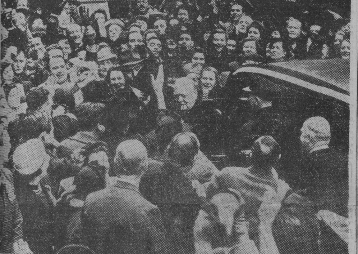
A su llegada a Kensington, para depositar su voto, el ex "premier" Winston Churchill es rodeado por la muchedumbre, que le aclama con entusiasmo.

DETROIT, 25. — La General Motors ha reducido en dos centavos por hora los salarios de sus 290.000 trabajadores y ha rebajado entre 10 y 40 dólares los precios de sus automóviles. Esta es la tercera vez que la General Motors reduce los salarios y los precios de venta de sus coches en consonancia con el contrato de trabajo concertado entre la empresa y los sindicatos, basado en el coste de la vida. En virtud del contrato de trabajo vigente, los salarios del personal de la General Motors se ajustan a un reajuste trimestral en consonancia con las oscilaciones que acusa el coste de la vida. — Efe.