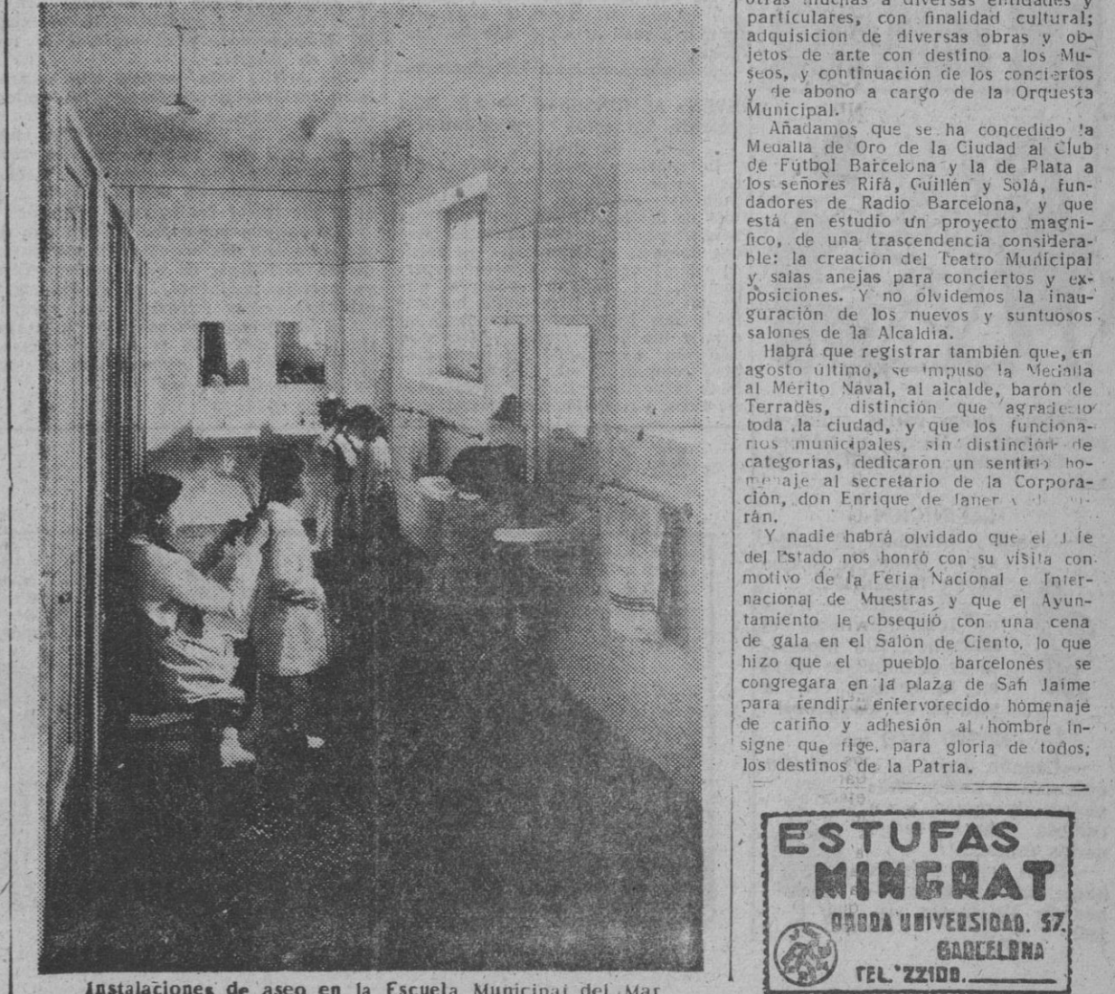
Instalaciones de asco en la Escuela Municipal del Mar