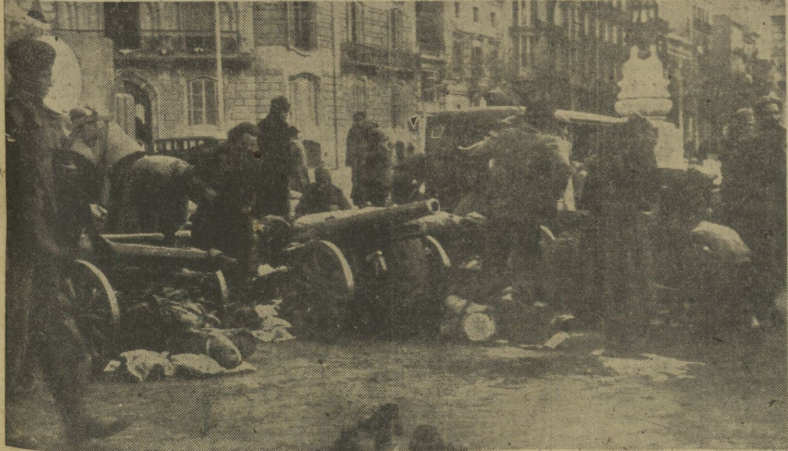
Rodean a la figura de S. E. el Jefe del Estado y Generalísimo de los Ejércitos, don Francisco Franco Bahamonde, dos fotografías que recogen otros momentos emocionantes de la efeméride que el pueblo barcelonés celebra hoy. En primer término la alegría desbordante de la población en el instante de verse liberada por las heroicas tropas españolas y en último lugar una avanzada de la artillería española, emplazada en el Paseo de Gracia-Diagonal, poco antes de iniciarse la ocupación total.