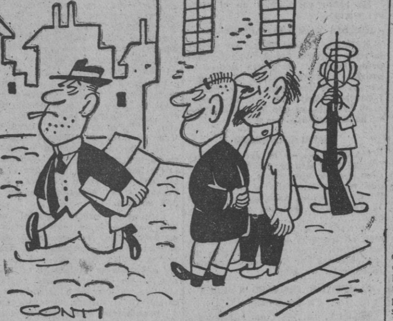
Es el abogado defensor. Un gran cerebro. El fiscal pidió veinte años pero él consiguió que le condenasen a muerte.

Por 6 votos contra uno y 5 abstenciones lo decidió el Consejo de Fideicomisos