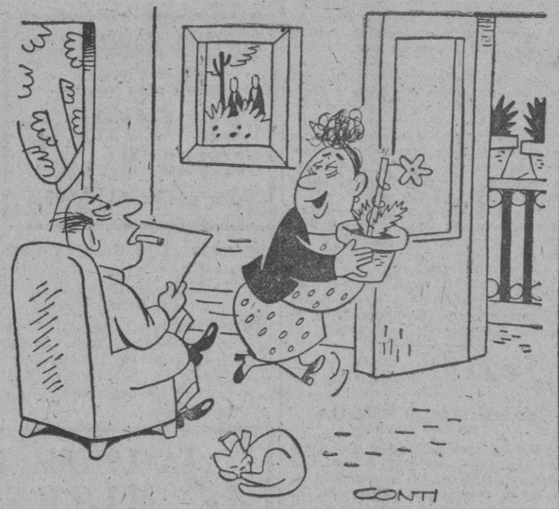
—Continuamente estás poniendo tiestos en el balcón. —Claro, querido. Es que en cuanto hace un poco de viento caen todos.