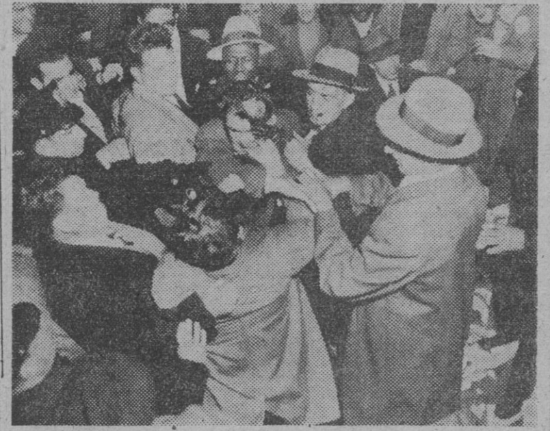
Un momento del choque entre derechistas e izquierdistas pertenecientes a la Unión Marítima Nacional, en Nueva York, que tuvo que ser cortado por la policía. Se practicaron dos detenciones y dos funcionarios de la Unión tuvieron que ser asistidos de diversas heridas. El choque se produjo cuando los comunistas interrumpieron una manifestación de sus antagonistas en apoyo de la reelección de Joe Curran, presidente derechista de la Unión.