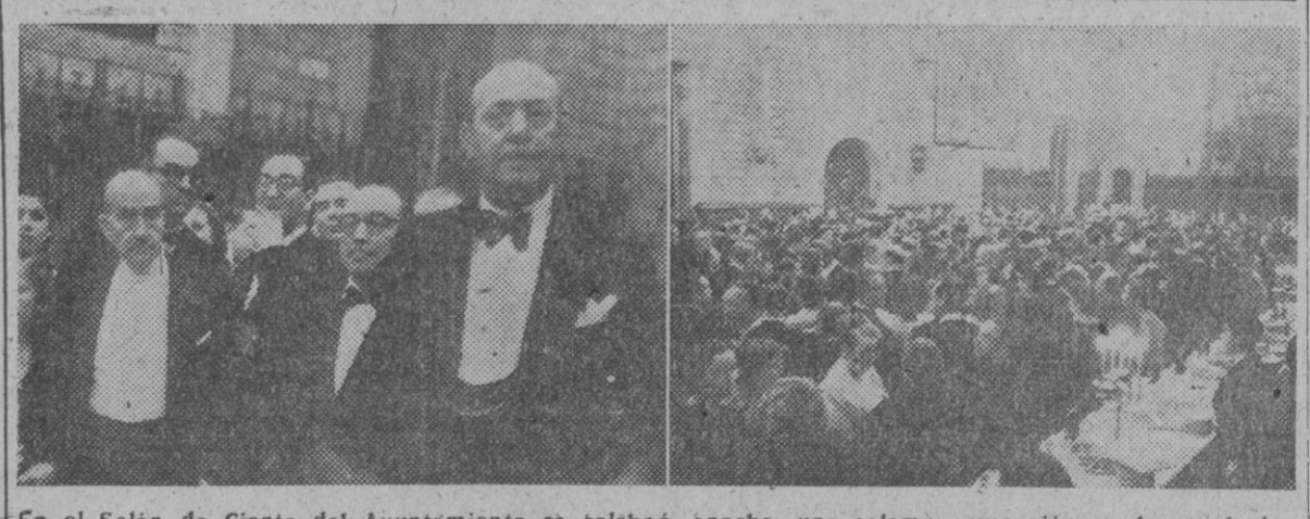
En el Salón de Ciento del Ayuntamiento se celebró, anoche, una solemne recepción en honor de los miembros del I Congreso Nacional de Cirugía...