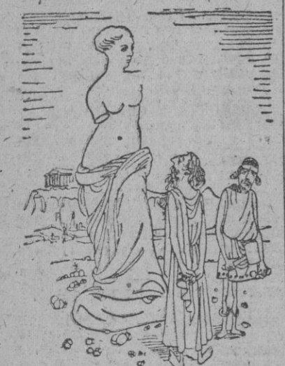
El escultor. — Nunca supe hacer los brazos.

BOXEO —Es muy halagador pensar que un boxeador — que millares y millares de radioteles están pendientes de mis puños! —Es cierto — le replicó su preparador — como también que por lo menos sabrán el resultado del combate diez segundos antes que tú!