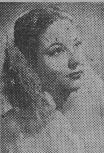
FIGURA DE LA ESCENA