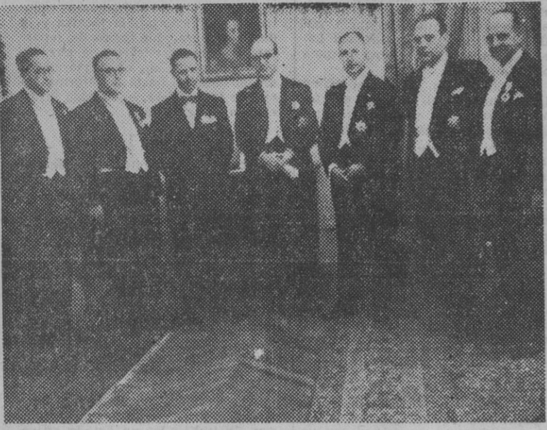
El ministro de Educación Nacional, señor Ibañez Martín, con el embajador de Portugal, señor Carneiro Pacheco, en el acto de imposición de la Gran Cruz de la Orden portuguesa de Instrucción Pública al subsecretario de Educación Popular, señor Ortiz Muñoz, y otras condecoraciones de dicho país a diversas personalidades españolas

Condecoraciones portuguesas a personalidades españolas