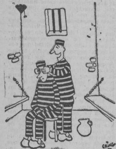
—¡Cu, cul...! ¿Quién soy yo? (De 'La Bataille')