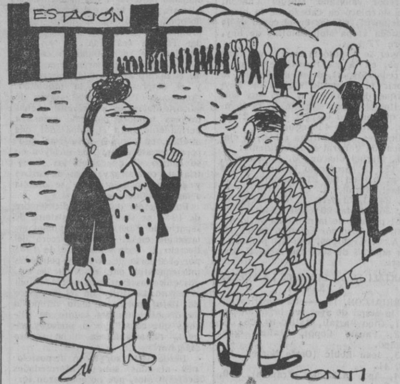
— Cuando saques los billetes no te olvides pedir un departamento de no fumadores y mi asiento junto a la ventanilla y de cara a la máquina.