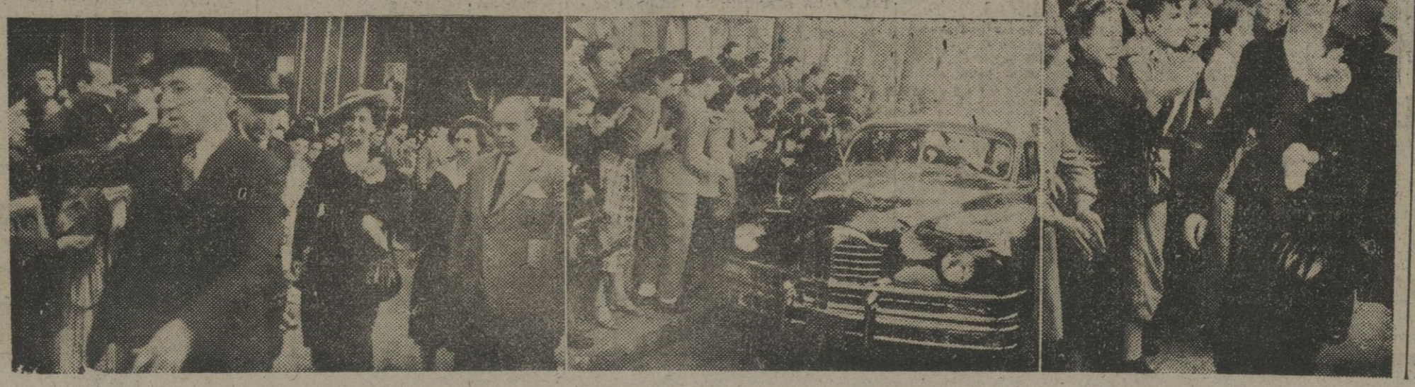
Doña Carmen Polo de Franco, esposa del Jefe del Estado, recorrió ayer, de compras, diversos lugares de nuestra ciudad, siendo acogida su presencia con vivas y espontáneas muestras de simpatía por parte de la población barcelonesa.

La primera dama de la Nación, excelentísima señora doña Carmen Polo de Franco, recorrió ayer, de compras, diversos lugares de nuestra ciudad, siendo acogida su presencia con vivas y espontáneas muestras de simpatía por parte de la población barcelonesa. Nuestro fotógrafo recogió fielmente algunos momentos del paso de doña Carmen Polo por entre las gentes que se congregaban al percibirse de su aparición, testimoniando a la esposa del Jefe del Estado el más expresivo homenaje que puede rendirse a la virtud, a la sencillez y a la afabilidad de una dama, por tantos conceptos ejemplarísima. La figura de doña Carmen Polo de Franco resume todas las altas cualidades de la mujer española, y es corazón de un hogar cristiano por excelencia y aliento constante junto al hombre, al héroe, al gobernante, cuya existencia ha transcurrido y transcurre por entero en esforzado y tenso servicio a la Patria. Correspondiendo con su peculiar gesto sonriente a las cálidas muestras de admiración y de afecto, atraviesa doña Carmen el espacio comprendido entre espesas filas de personas de toda edad y condición, que rinden honor a un tiempo a la egregia dama y a los nobles y corteses sentimientos que siempre distinguieron a Barcelona.