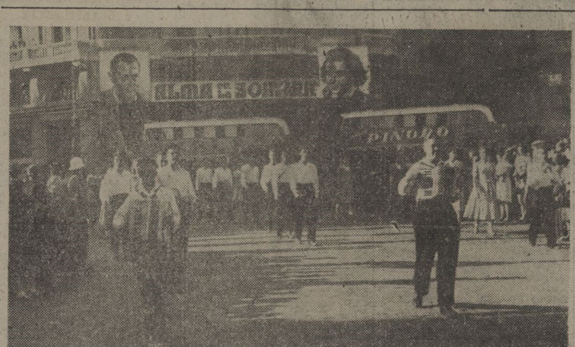
Estos días se celebra, en Madrid, un concurso de Coros y Danzas Internacional. He aquí el desfile de todos los concursantes que recorrieron las principales calles de la ciudad. En la foto, los concursantes de Flandes y Bélgica.