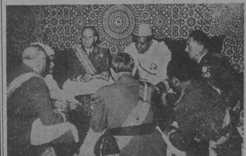
S. A. I. el Jalifa, acompañado del alto comisario de España en Marruecos, teniente general Varela, y otros generales, durante la cena de gala que se celebró en el palacio jafidiano.