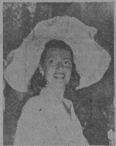
En la pequeña ciudad francesa de Vallauris, cerca de Cannes, contrajeron matrimonio recientemente Rita Hayworth y el príncipe indio Ali Khan, hijo del Aga Khan. La boda tenía que realizarse en un castillo cercano a la localidad, pero el alcalde comunista de Vallauris, se negó a ello y se le obligó a casarse en el Ayuntamiento. En la foto vemos a Rita sonriendo después de la boda.