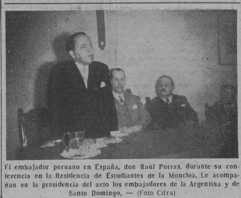
El embajador peruano en España, don Raúl Porras, durante su conferencia en la Residencia de Estudiantes de la Moncloa...