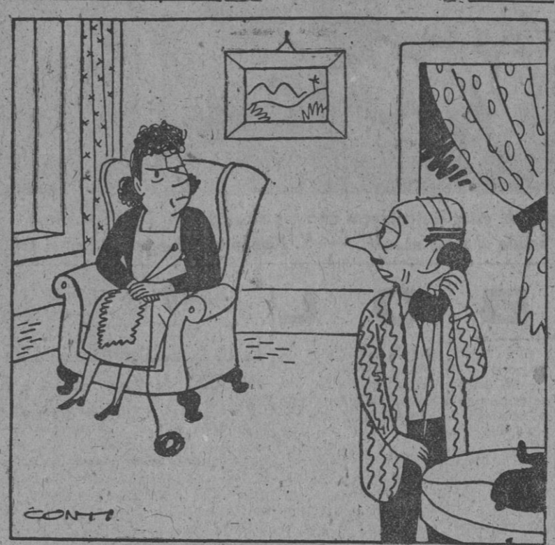
— Me invitan a una conferencia sobre las libertades del hombre. ¿Puedo ir? —