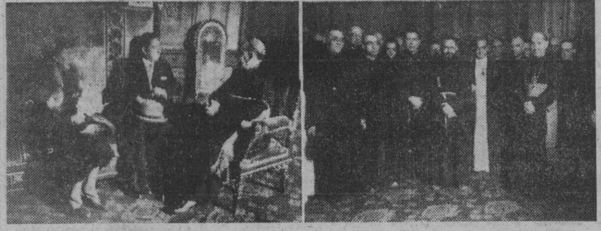
Hoy todas las autoridades barcelonesas, las asociaciones religiosas y representaciones de todos los sectores sociales han cumplimentado al señor obispo, doctor Modrego Casaus, con motivo de su onomástica. He aquí la felicitación de S. E. el gobernador civil y de su distinguida esposa y la de las Ordenes religiosas.

«Es intolerable que la defensa occidental de Europa no sea confiada a un jefe francés»