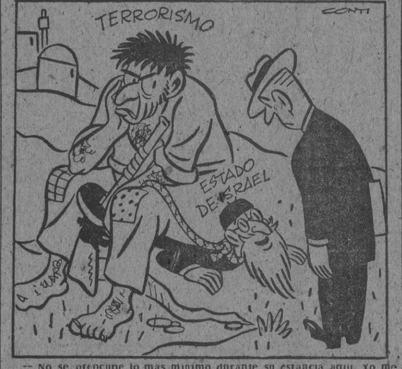
No se preocupe lo más mínimo durante su estancia aquí, yo me encargo de su protección personal.