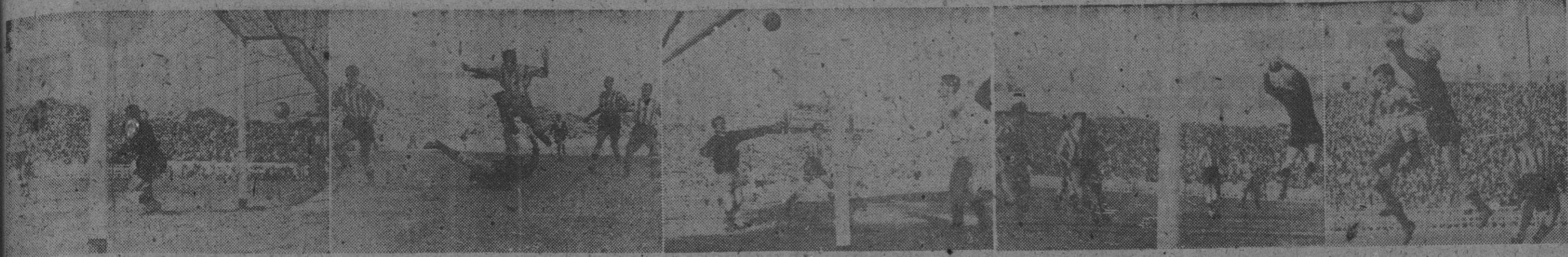
Las fotos nos muestran el primer tanto españolista, logrado por Artigas a poco de empezar el encuentro. — El interior Piquín logró de esta forma uno de los cuatro tantos blanquiazules. — El gol de Vidal, único de los visitantes, y dos emotivas jugadas, durante el partido. — (Fotos Pérez de Rozas)