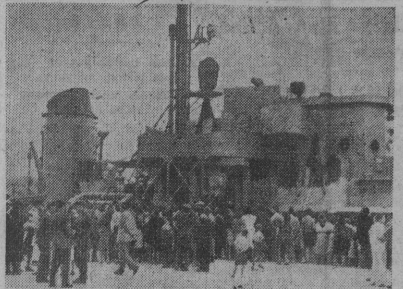
La fragata cubana «Antonio Maceo», que ha venido a España para asistir a los actos del VII Centenario de la Marina de Castilla, atracando en el puerto de Portugalete.