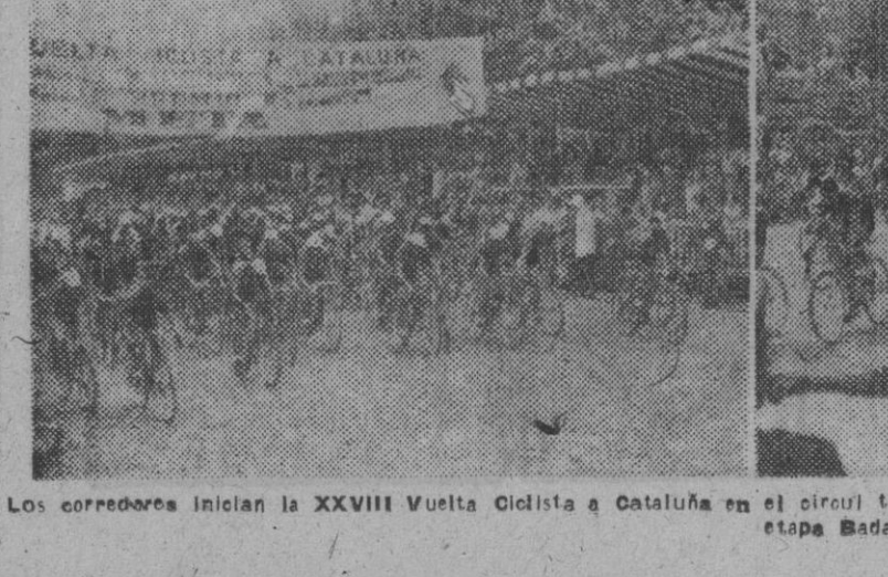
Los corredores inician la XXVIII Vuelta Ciclista a Cataluña en el circuito de Montjuich, y una fase de la misma en la escalada al Estadio. — El pelotón, seguido de Gual, en la etapa Badalona-Figueras. — (Fotos Pérez de Rozas)