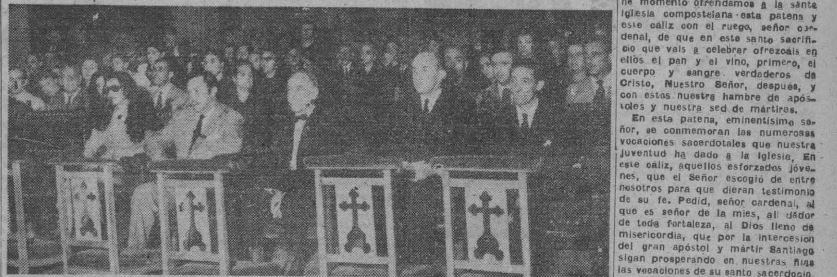
Constituido por los súbditos mejicanos residentes en Madrid se celebró en la Iglesia de Jesús de Medinaceli un solemne funeral por el alma de «Manolete» con motivo de cumplirse el primer aniversario de su muerte.