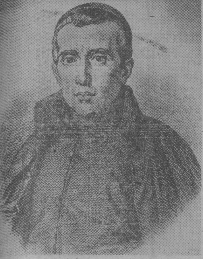
El gran filósofo vicense, Jaime Balmes, cuyo centenario de su muerte se celebra en Vich con solemnes actos cívicos religiosos, y al que se han sumado toda España