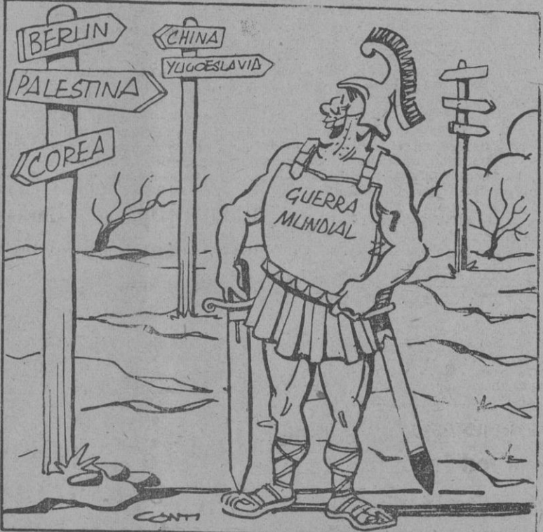
—Esta Humanidad cada día más complaciente. ¡Ya no sabe uno por donde empezar!

Fallece el político portugués José Simoes Raposo