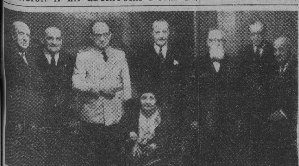
El ministro de Educación Nacional, señor Ibañez Martín, con otras personalidades, en el momento de imponer la Gran Cruz de Alfonso X el Sabio a la ilustre escritora doña Blanca de los Ríos.

DISTINCION A LA ESCRITORA DOÑA BLANCA DE LOS RIOS