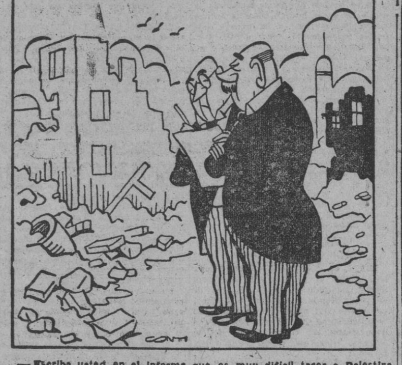
—Escriba usted en el informe que es muy difícil traer a Palestina un ejército internacional. No hay sitio para alojarlo.