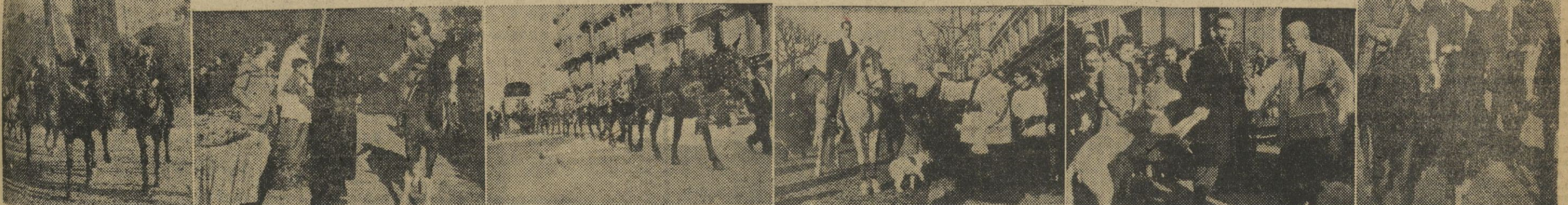
I. El abanderado y sus acompañantes, que presiden la cabalgata de los "Tres Tombs". — II. El gobernador civil, en el Polo, da la mano a una linda amazona que asiste a la tradicional bendición. — III. Una recua de animales llevados a bendecir en San Antonio Abad. — IV. Un gallardo jinete que monta un magnífico ejemplar, en los Escolapios. — V. Bendición de un perro con motivo de la festividad del día. — VI. Tres bellas amazonas conduciendo sus caballos ante el sacerdote.