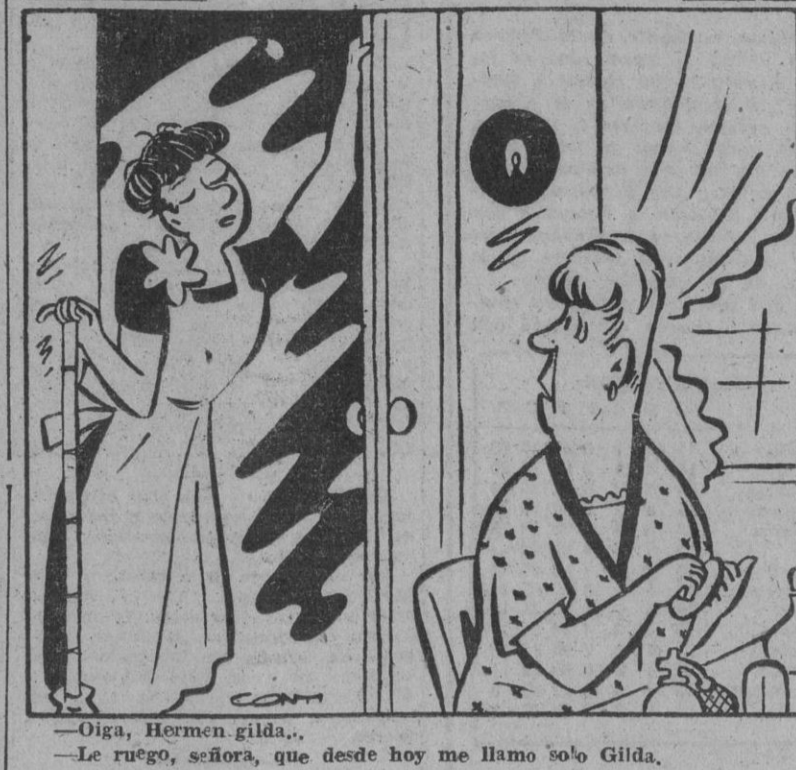
Diga, Hermen gilda... Le ruego, señora, que desde hoy me llamo 'solo Gilda'.