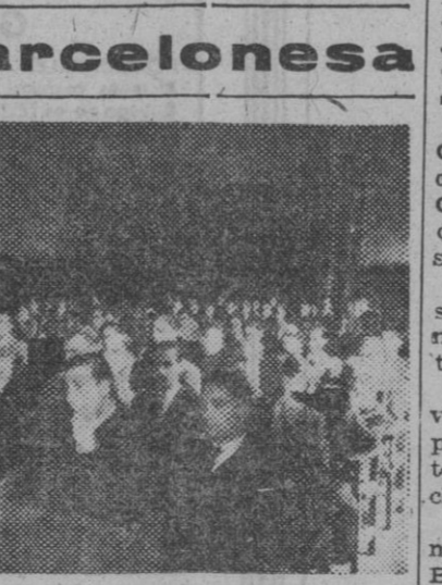
Esta mañana han tomado posesión los nuevos directores de la nueva Cámara Sindical Agraria, en la que ha pronunciado un interesante discurso el gobernador civil. — II. En la Universidad se ha celebrado el XIV aniversario de la fundación del SEU. He aquí parte del público asistente.