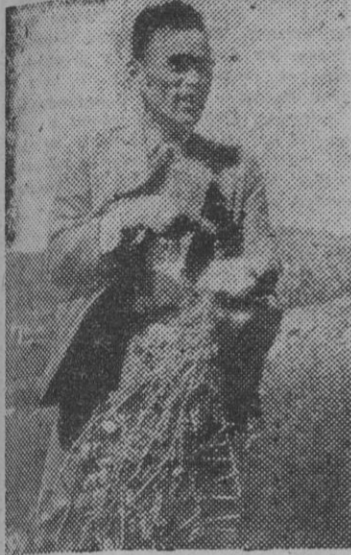
A los efectos de la radioactividad de la bomba atómica se atribuye el fenómeno de las patatas recogidas en las vegas de Nagasaki (Japón), donde fué lanzada una de las bombas que decidieron la guerra en el Extremo Oriente, sean dulces, y la cosecha más abundante que en años de normalidad.