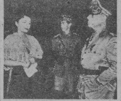
Un interesante plano de "Cinco tumbas al Cairo", película que se estrenará el lunes en el elegante salón Cristina.