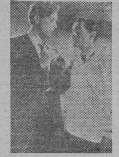
Laurence Tierney, en una escena del film, "Dillinger", que Cepesa presentará el próximo lunes en los cines Capitolio y Metrópoli.