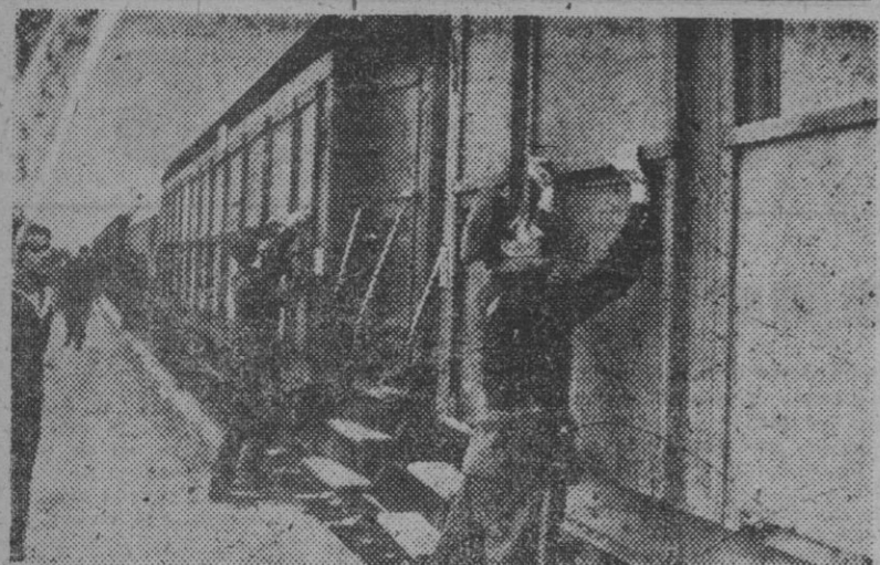
El primer trun de viajeros finlandeses que pasó a través de las fortificaciones soviéticas de Porkkala tuvo que cerrar sus ventanillas con estas planchas de hierro que impedian toda visión exterior a los viajeros...