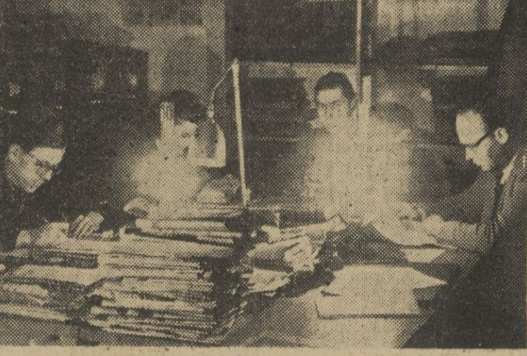
La insuficiencia en la producción de energía eléctrica hace que los fran- ceses se vean obligados a usar los más diversos sistemas de alumbrado...