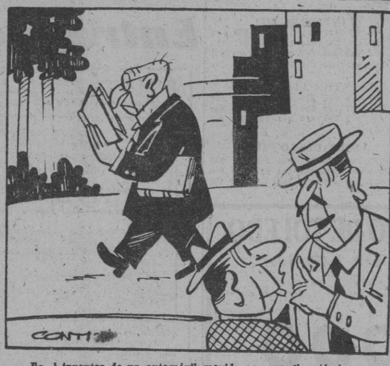
—Es el inventor de un automóvil movido por energía atómica, pero él siempre va a pie.