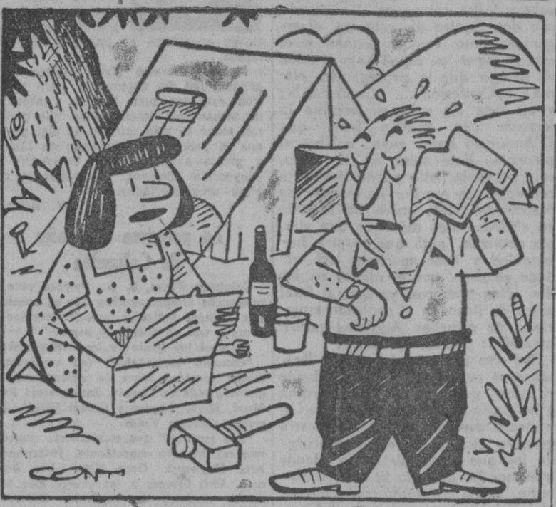
— Bueno, ya he terminado de instalar la tienda de campaña, pero son las siete y hemos de coger el último tren a las ocho.