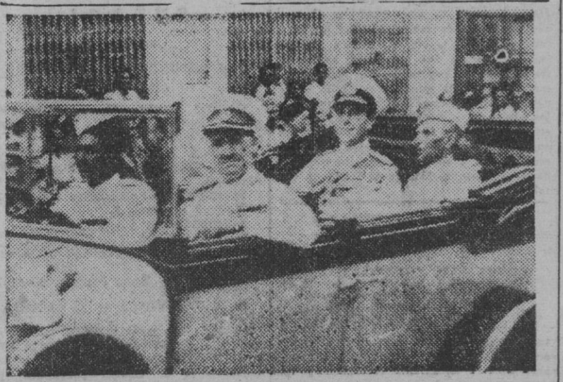
Lord Mountbatten, último virrey de la India, y Mohamed Ali Jinnah, gobernador general del nuevo Estado indio del Pakistán recorren las calles de Karachi, después de la entrega de poderes a este último.