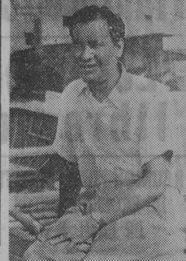
Una escena del film «Tifón», con que hoy inaugura su temporada el Coliseum