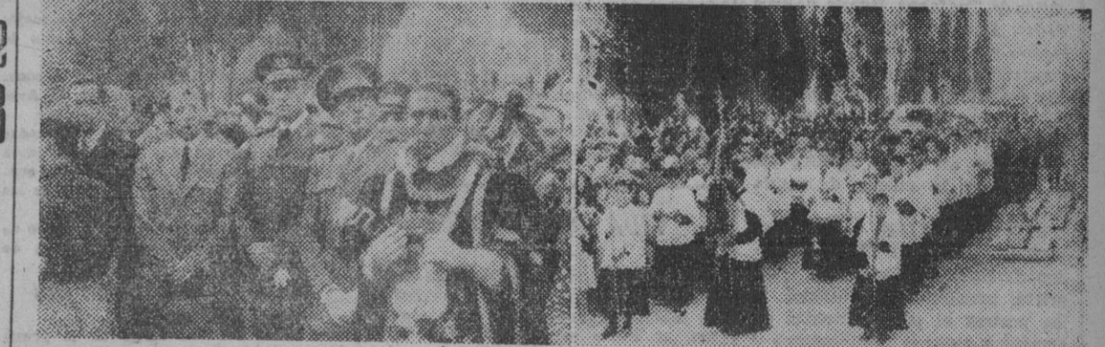
I. El ministro de la Gobernación, don Blas Pérez González; el capitán general de la Primera Región Militar, don Agustín Muñoz Grandes, y otras personalidades, en la presidencia oficial del entierro de las víctimas de la explosión del polvorín de Alcalá de Henares. — II. La población, congregada en el cementerio, para presenciar el paso de la fúnebre comitiva.