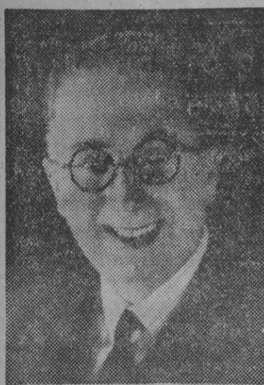
FIGURA DEL TEATRO