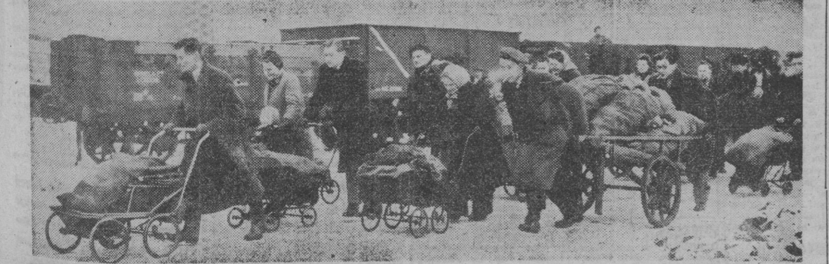
Los habitantes de Fulham, con toda clase de vehículos, transportan a su casa el racionamiento de carbón que tienen asignado.

Comentario de Wallace sobre los adelantos atómicos