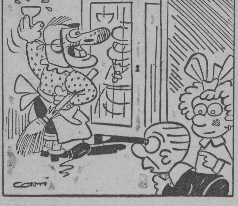
— ¿Quién es éste? — Es papá, se vuelve fofo por disfrazarse y celebra el Carnaval a solas.