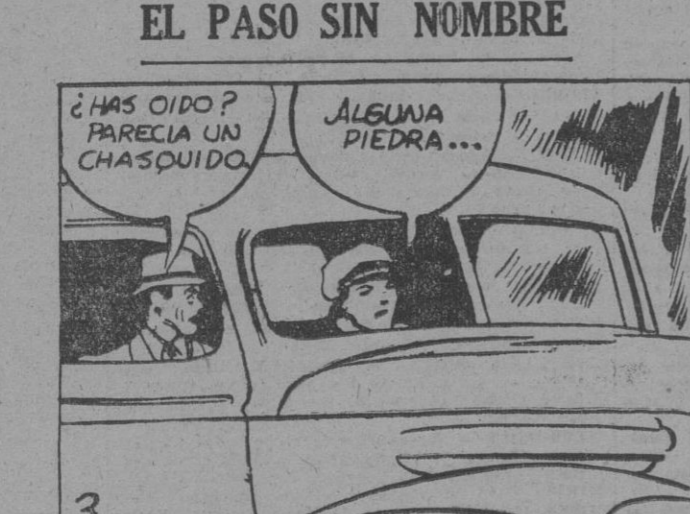
¿HAS OIDO? PARECIA UN CHASQUIDO. ALCUNA PIEDRA...