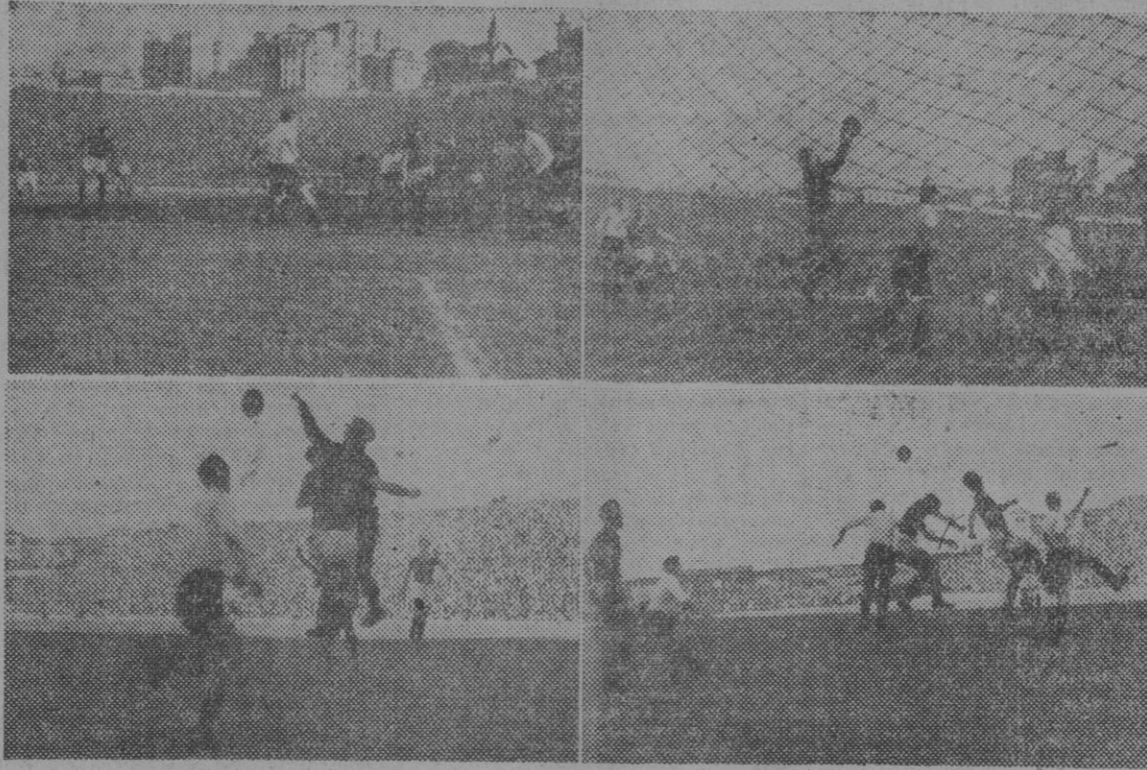
Aparte de los seis tantos que el San Lorenzo consiguió en la puerta de Bañón, éste pasó por momentos de gran apuro. En las tres primeras fotos podemos ver a la defensa española en plena acción para defenderse de los constantes ataques argentinos. — En la última instantánea, puede apreciarse un córner sobre la puerta argentina, salyado por Zubietta.

Personalidades argentinas visitan la Academia Nacional de Mandos del Frente de Juventudes