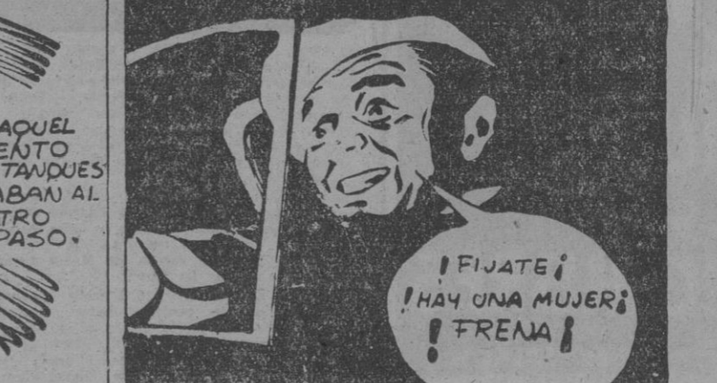
¡FIJATE! ¡HAY UNA MUJER! ¡FRENA!

ATENAS, 17. — El Gobierno griego presentará una protesta a la Gran Bretaña y otros países aliados, por no haber sido invitados a enviar un representante a la Conferencia de delegados de ministros de Asuntos Exteriores de los "cuatro grandes" que se celebra en Londres. Grecia tenía la intención de presentar reclamaciones financieras y económicas contra Alemania. — Efe.