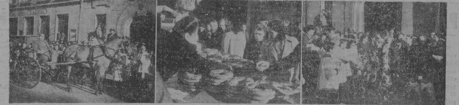
Como todas las fiestas tradicionales, de gran arraigo popular, Barcelona celebra el día de San Antonio Abad con la bendición de caballerías, castuema de "fortells", propios de la festividad, así como "panellets" benditos. He aquí tres aspectos de los actos propios del día.