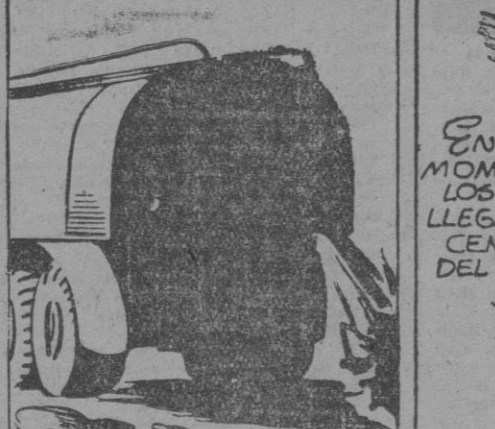
EN AQUEL MOMENTO LOS TANQUES LLEGABAN AL CENTRO DEL PASO.