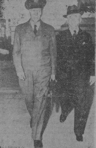
El nuevo secretario de Estado de los Estados Unidos, y general Marshall, con el secretario saliente Byrnes

Hertzog, definitivamente elegido presidente de Bohemia