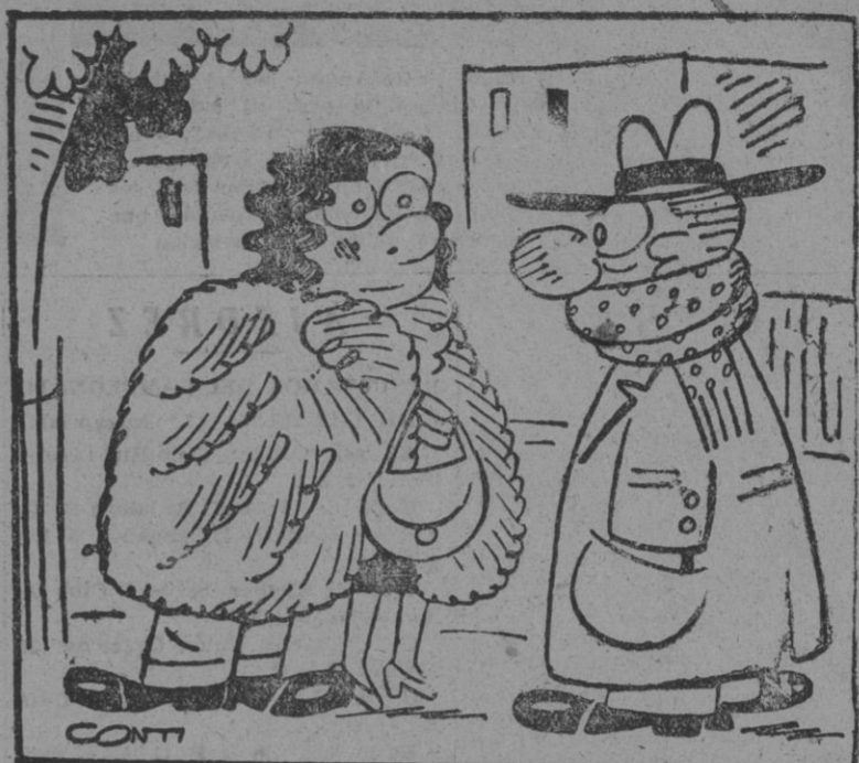
—Es que mi marido no puede comprarse el abrigo hasta que cobre la paga de Navidad.