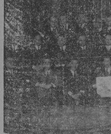
Asistentes a la comida de despedida celebrada en el Hotel Ritz, de Madrid, en honor del director de la United Press en España, Mr. Forte, que marcha a los Estados Unidos después de haber dirigido durante cinco años dicha Agencia.