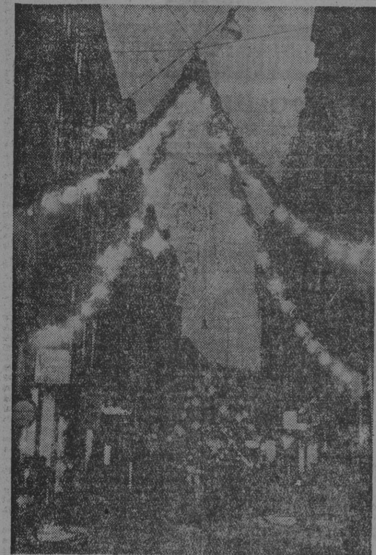
Numerosas calles de la capital sueca aparecen engalanadas; estos días con "Christmas", colgaduras y luces de colores, ofreciendo aspectos tan pintorescos como el que reproduce la fotografía.