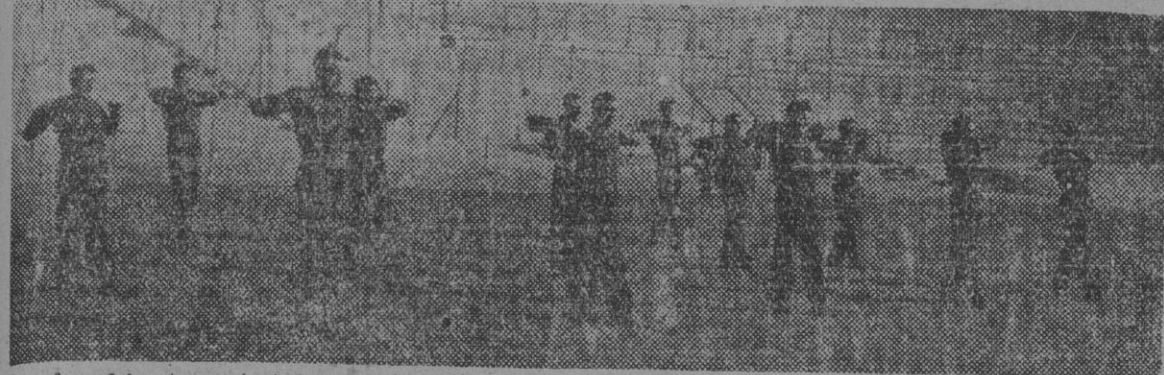
Una fase del entrenamiento a que se dedicaron ayer, en el Estadio Metropolitano, de Madrid, los jugadores del San Lorenzo de Almagro.