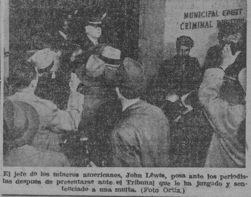
El jefe de los mineros americanos, John Lewis, posa ante los periodistas después de presentarse ante el Tribunal que lo ha juzgado y sentenciado a una multa.