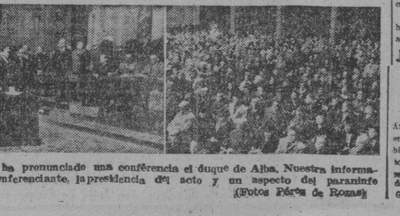
En el paraninfo de la Universidad ha pronunciado una conferencia el duque de Alba. Nuestra información gráfica nos muestra al ilustre conferenciante, la presidencia del acto y un aspecto del paraninfo.