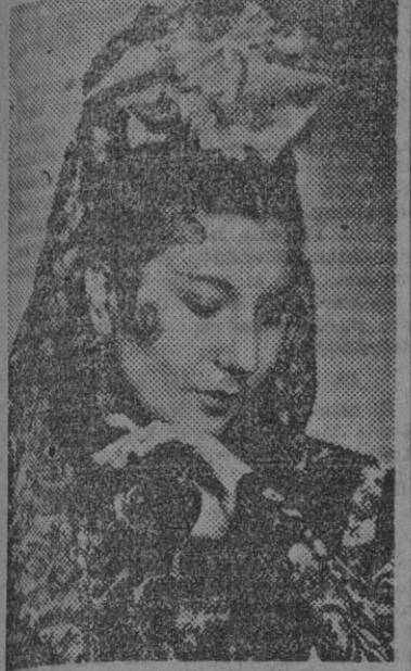
La famosa bailarina Pilar López, cuyo "Bolero español" ha tenido un gran éxito

En el verano de 1942 una joven española pasaba sus vacaciones en Rye Beach, un lugar costero próximo a la ciudad de Nueva York.