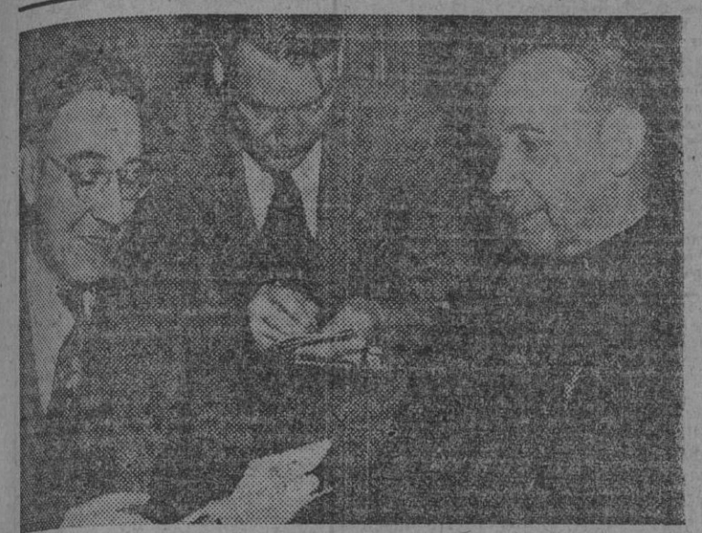
El Excmo. y Revdmo. señor don Gregorio Modrego, obispo de Barcelona, en su llegada al aeródromo La Guardia, de Nueva York, procedente de Amsterdam, para asistir al Congreso Catagístico Mundial celebrado en Boston, es entrevistado por los periodistas.

"El Gobierno inglés sigue una política disparatada en la India y Palestina"