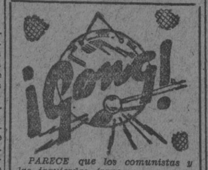
PARECE que los comunistas y las izquierdas francesas en general se muestran disgustados por el triunfo derechista de las elecciones. Los bolchevístas vecinos temen que en Washington se muestren reserados en ayudar a los países europeos en los que gobierna o espera gobernar la extrema izquierda.

NEUVA YORK, 7. — El resultado de las elecciones no ha tenido grandes repercusiones en las cotizaciones de la Bolsa de Nueva York. Al recibirse las primeras noticias, aumentó la demanda de valores. Lo que produjo una subida general que llegó en algunos casos hasta dos enteros. Posteriormente, ha disminuido la demanda y las cotizaciones bajaron al nivel del lunes e incluso fueron inferiores en algunos mercados. — Efe.