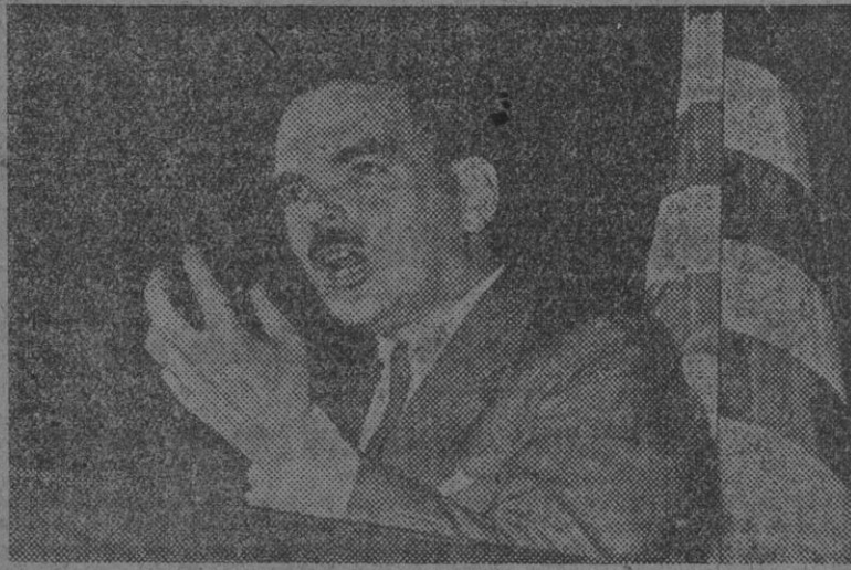
Del triunfo republicano en las elecciones norteamericanas se perfila ya la figura de Dewey para presidente. Al actual gobernador de Nueva York le vemos en la foto durante su discurso en la Asamblea del Partido Republicano, aceptando su nombramiento como candidato a la Presidencia de los Estados Unidos.

24 de mayo de 1902. Tiene, pues, en la actualidad 44 años. Físicamente es pequeño de talla, de tez morena, ojos grandes y pelo abundante y canoso, que lleva siempre perfectamente peinado. Tiene la coquetería de vestir muy bien y de llevar siempre muy arreglado su bigote de doble cepillo, que se dejó crecer desde un viaje que hizo a Francia. Es fotogénico—un factor a su favor en la campaña presidencial futura—y posee una agradable voz de barítono con la que sabe llegar al corazón de las gentes cuando habla (otro factor importantísimo para la lucha política).