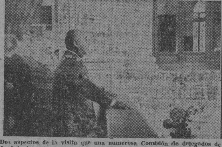
Dois aspectos de la visita que una numerosa Comisión de delegados de la Asamblea de Labradores y Ganaderos, hizo al Caudillo en el Palacio de Oriente para expresarle su adhesión. El Jefe del Estado les dirigió la palabra y luego conversó con varios de los delegados.

El Caudillo recibe a los delegados de la Asamblea de Labradores y Ganaderos