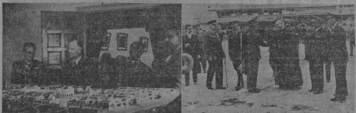
Durante la estancia de la Misión argentina en Madrid, visitó el Departamento de Regiones Devastadas...