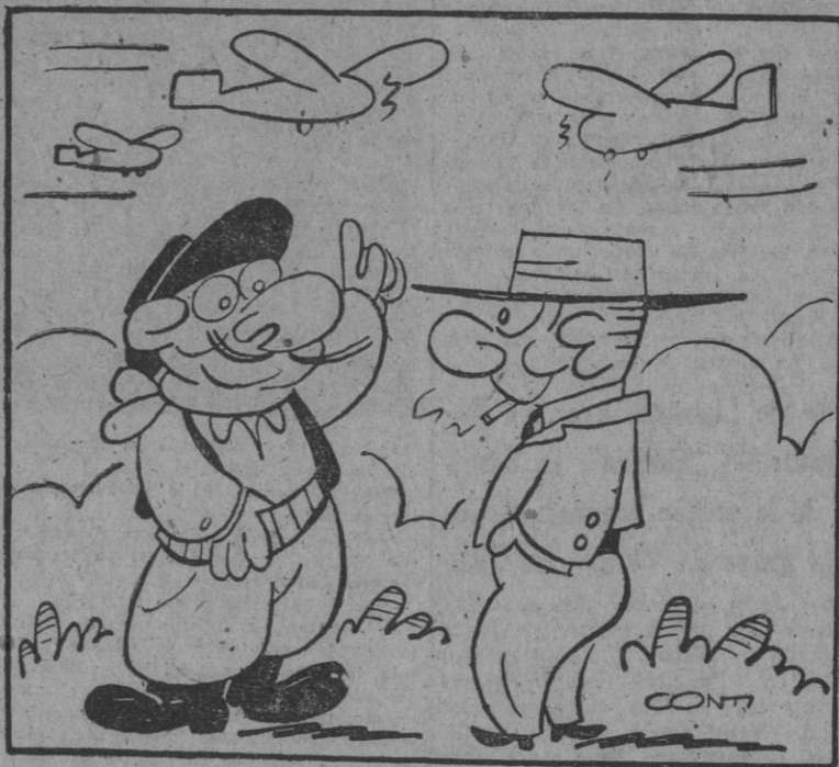
Buena idea esta de las nuevas líneas, viejo. Así podremos renovar con más frecuencia nuestra sincera amistad.