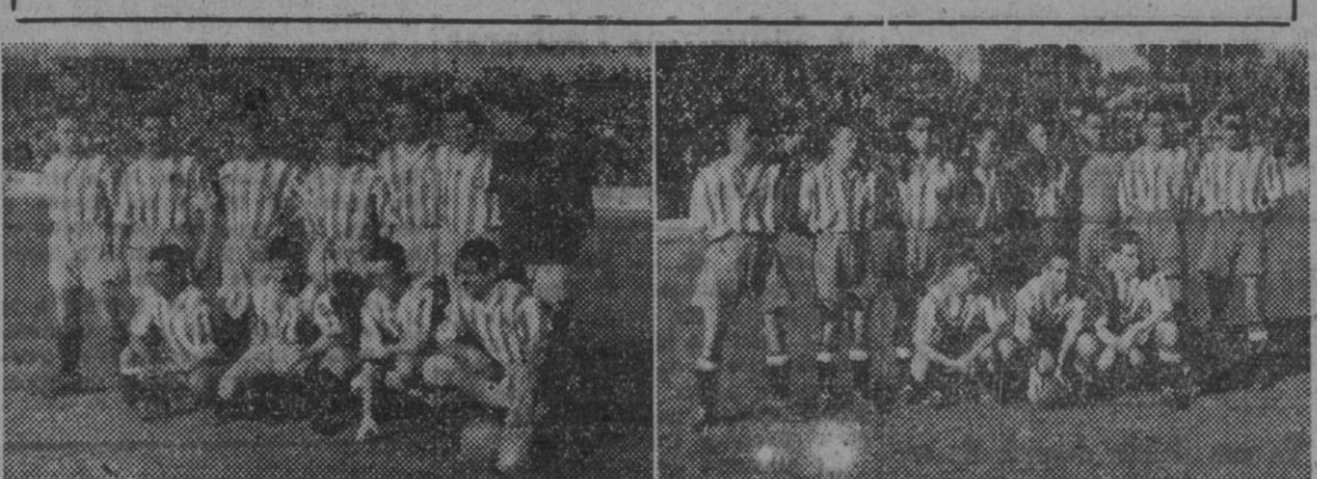
Los equipos del Español y Gijón, que jugaron ayer en Sarriá.