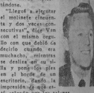
Hugo del Carril, el famoso actor y cantante argentino, que desempeña un importante papel en la película 'La novela de un joven pobre'.

Van Johnson debe en parte su robusta apariencia a un viejo trapezista que vivía en el patio de una modesta casa de New York.