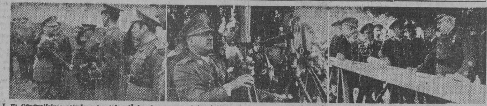
I. El Generalísimo saluda a los jefes de las fuerzas que interviniéron en el supuesto táctico que se ha celebrado en Mendizorroz. — II. A través de un telémetro de campaña, el Jefe del Estado sigue atentamente el desarrollo del supuesto táctico. — III. S. E. cambia impresiones sobre el desarrollo de los ejercicios con los generales Yagüe y Cremades.

Con motivo de la posesión del nuevo presidente de Colombia Eduardo Marquina, recibido por el presidente saliente, señor Lleras Camargo