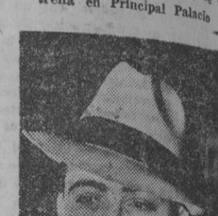
Una escena del film en 'Jornada de un hombre que aprieta', que hoy se exhibe en Principal Palacio.

Robert Montgomery, director del film 'La dama del lago' Robert Montgomery debuta como director en la película 'Lady in the Lake'.