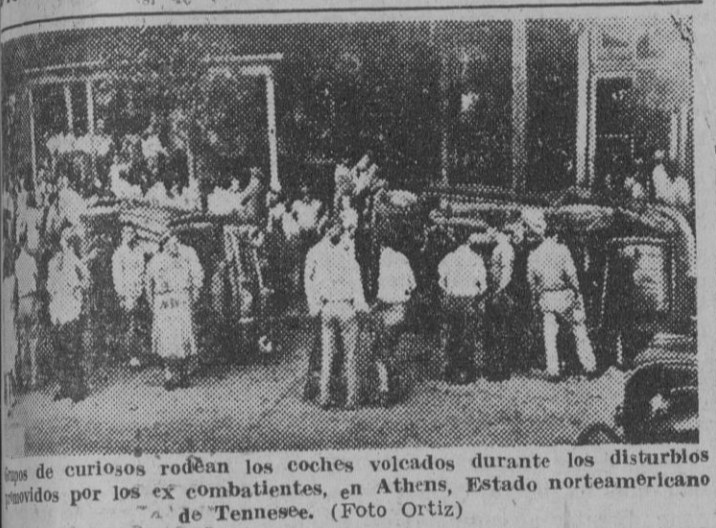
Curiosos rodean los coches volcados durante los disturbios...