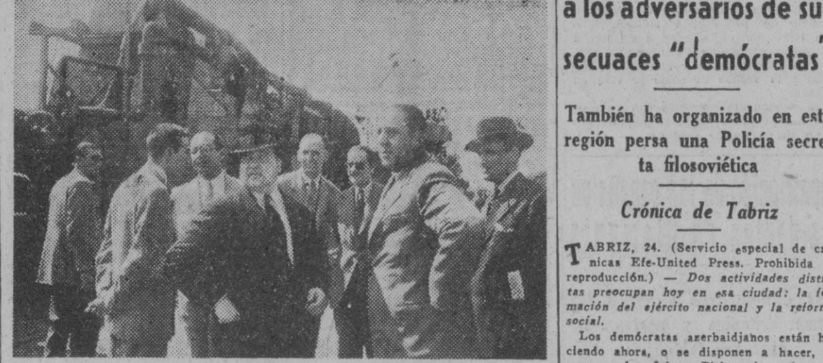
Los delegados provinciales de Industria y Comercio, Ingenieros y periodistas, presencian el acoplamiento de la nueva central térmica a los vagones plataforma, una vez descargada del barco que la ha traído a nuestro puerto.