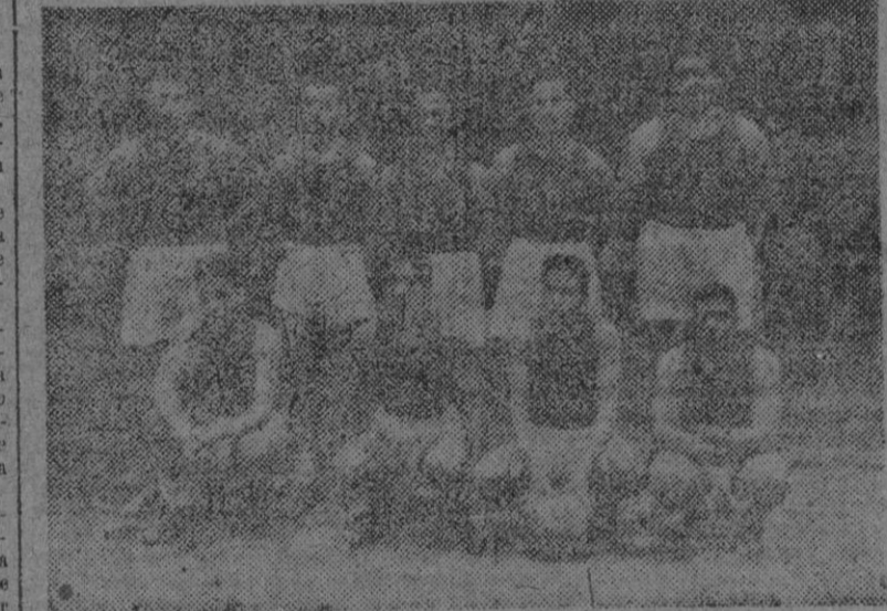
El equipo portugués