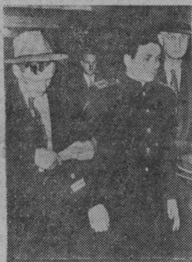
El teniente de la Marina soviética, Nicolai Gregorovich Redin, en el momento de ser detenido por dos policías norteamericanos cuando se disponía a embarcar en un buque ruso en el puerto estadounidense de Portland.

Inmediatamente después de tomar juramento al nuevo Gabinete