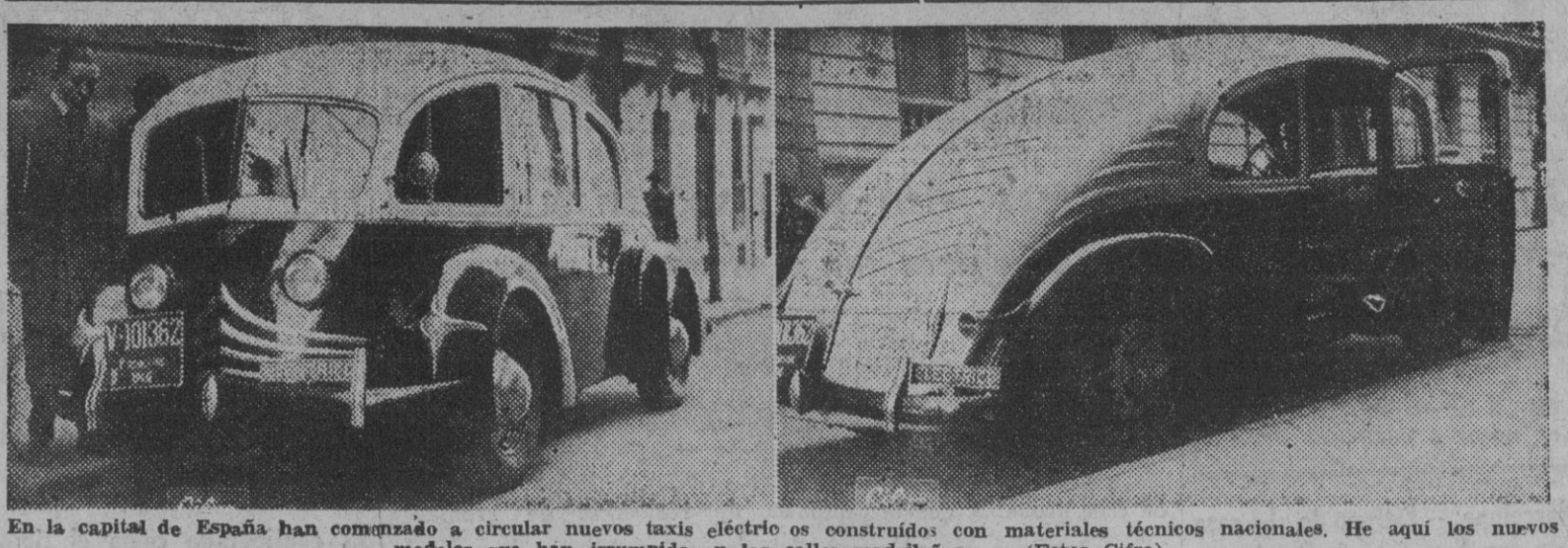
En la capital de España han comenzado a circular nuevos taxis eléctricos construidos con materiales técnicos nacionales. He aquí los nuevos modelos que han irrumpido en las calles madrileñas.