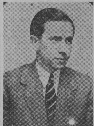
Juan Antonio Samaranch

patines, a primera vista iguales que los que usan nuestros deportistas, pero sin tiras de cuero.