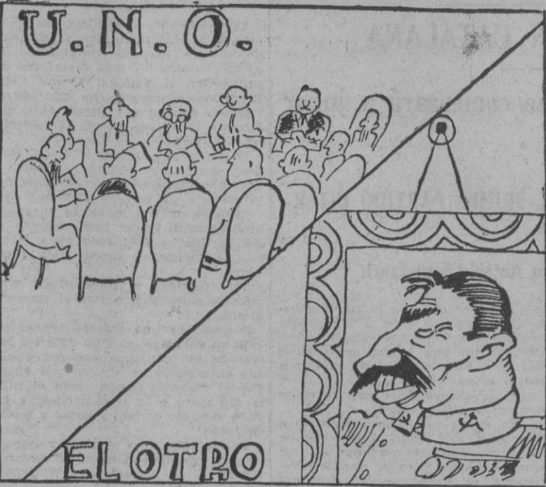
La diferencia de una letra