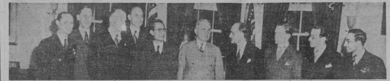
El presidente de los Estados Unidos, Mr. Truman, con los miembros de la Comisión de la U. N. O. que se encuentran en Nort-América con el fin de elegir la sede de la nueva organización.