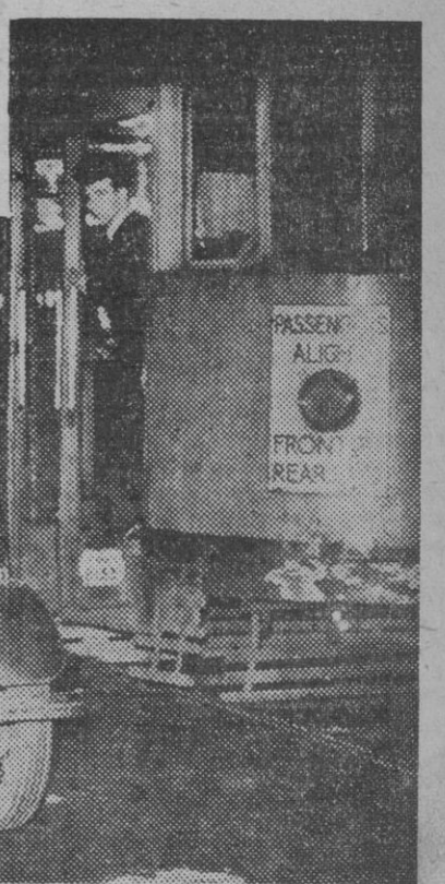
Como consecuencia de la ola de crímenes, la mayor hasta ahora conocida en la capital británica, todo el West End de Londres ha sido acordonado recientemente por la policía, que con la colaboración de las fuerzas militares, navales y aéreas de tres naciones ha revisado la documentación de cuantos elementos encontraba a su paso. He aquí un momento de la actuación policíaca.

Bidault ha justificado su actitud ante la Asamblea