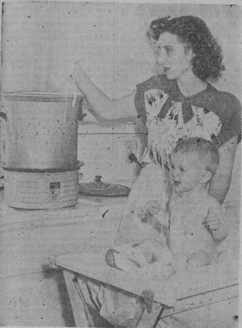
He aquí a una joven madre de Norteamérica lavando la ropa de su hijo por medio del procedimiento ultrarrápido logrado con una máquina de reciente invención, que dice ser una maravilla en su género