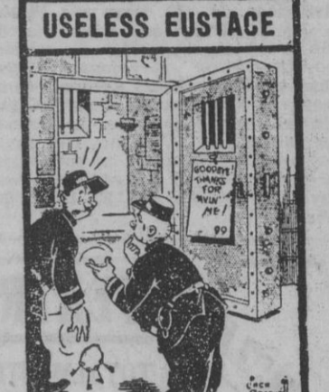
—A ver cómo podemos detener al número 99. Se ha escapado porque me equivocó y le cogió las llaves a la espalda. (De "Daily Mirror")

EL "QUILATE" ES POCO FIJO. La unidad de peso para las transacciones de piedras y metales preciosos, conocida en el mercado de alhajas con el nombre de "quilate", no tiene el mismo peso en todas las naciones.