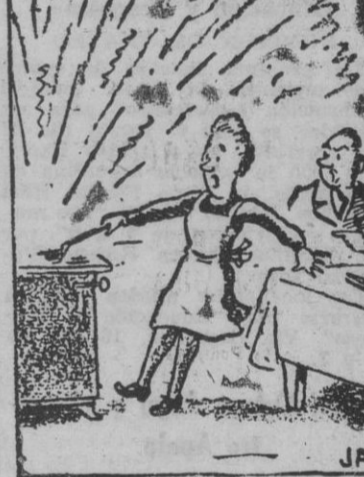
—¿Ah!... ¿era música? ("El Gráfico", Buenos Aires)