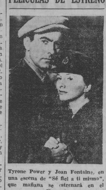
Tyrone Power y Joan Fontaine, en una escena de "Sé fiel a ti mismo", que mañana se estrenará en el Kursaal