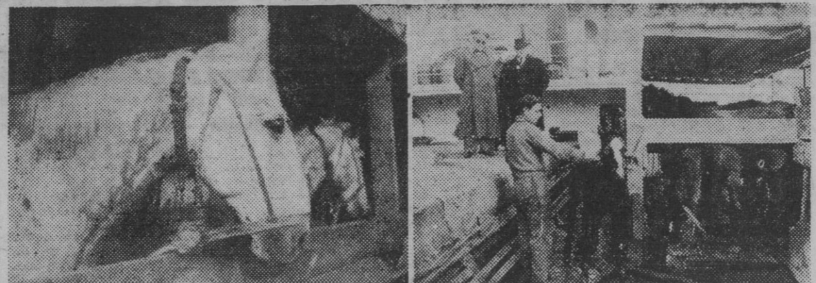
Con destino a los centros de reproducción del Ejército, ha llegado esta mañana a nuestro puerto una partida de 58 caballos sementales de pura raza, procedentes del Uruguay...