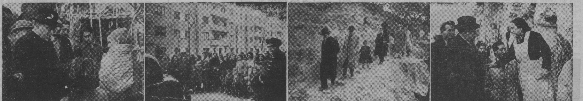
Cuatro momentos de la visita girada por el Excmo. Sr. gobernador civil a los suburbios barceloneses, para hacer entrega de donativos navideños a sus habitantes.