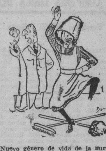
—Lo malo de usted es que va a ver muy a menudo comedias de mar.