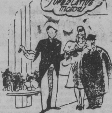
—Esto es hasta ahora sólo lo que ha venido de nuevos coches. (De "Daily Herald")

MADRID, 18. — El periódico "Informaciones" publica un reportaje sobre una curación prodigiosa de un niño recién nacido, cuya vista se consideraba totalmente perdida, a causa de una oftalmía purulenta y que ha quedado totalmente curado al recibir las aguas del bautismo.