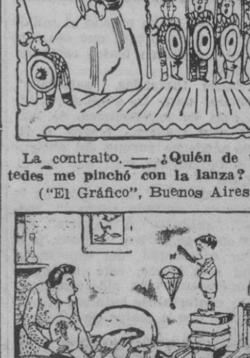
—¿Si habrá inventado una bomba atómica?... (De "Sunday Dispatch")