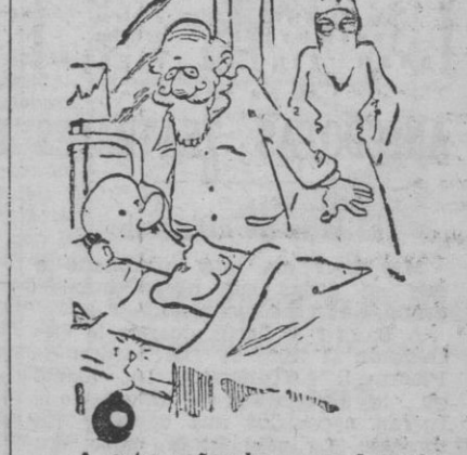
A este señor hay que hacerle otra operación. — Pero, ¿qué tiene? — ¡Dinero!