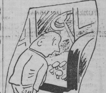
PUESTA EN MARCHA — ¡Vaya! Los hongos se han reproducido en abundancia.