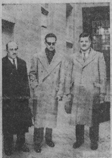
M. Clegeux, inspector general del Ministerio de Agricultura y Alimentación de Francia, y M. Lemirre, alto funcionario del Ministerio citado, con el señor Comas, de Abastecimientos y Transportes de España (en el centro), durante la estancia de dichas personalidades en Madrid