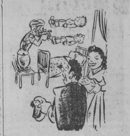
EN CASA DEL FAQUIR — No se asuste; es mi marido que duerme a los niños.