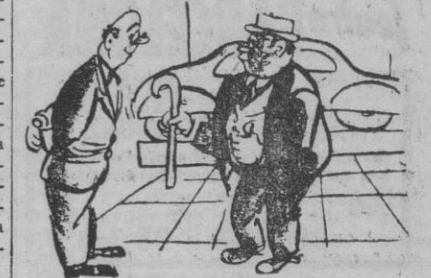
NUEVO MODELO — ¿Pero cómo se sabe cuándo este automóvil mira hacia adelante o hacia atrás? — Por la visera de la gorra del conductor.