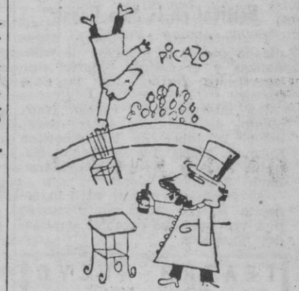
Meros mal que no se ha dado cuenta de que le he quitado la botella del vino.