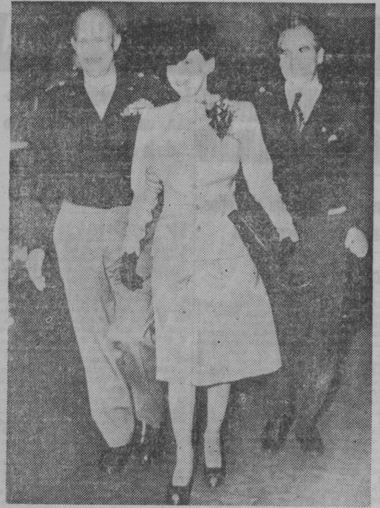
Poco después de su llegada a esta ciudad, el general Eisenhower acompaña a su esposa a comer en un hotel neoyorquino. A la derecha, el mayor John E. Kerrigan.