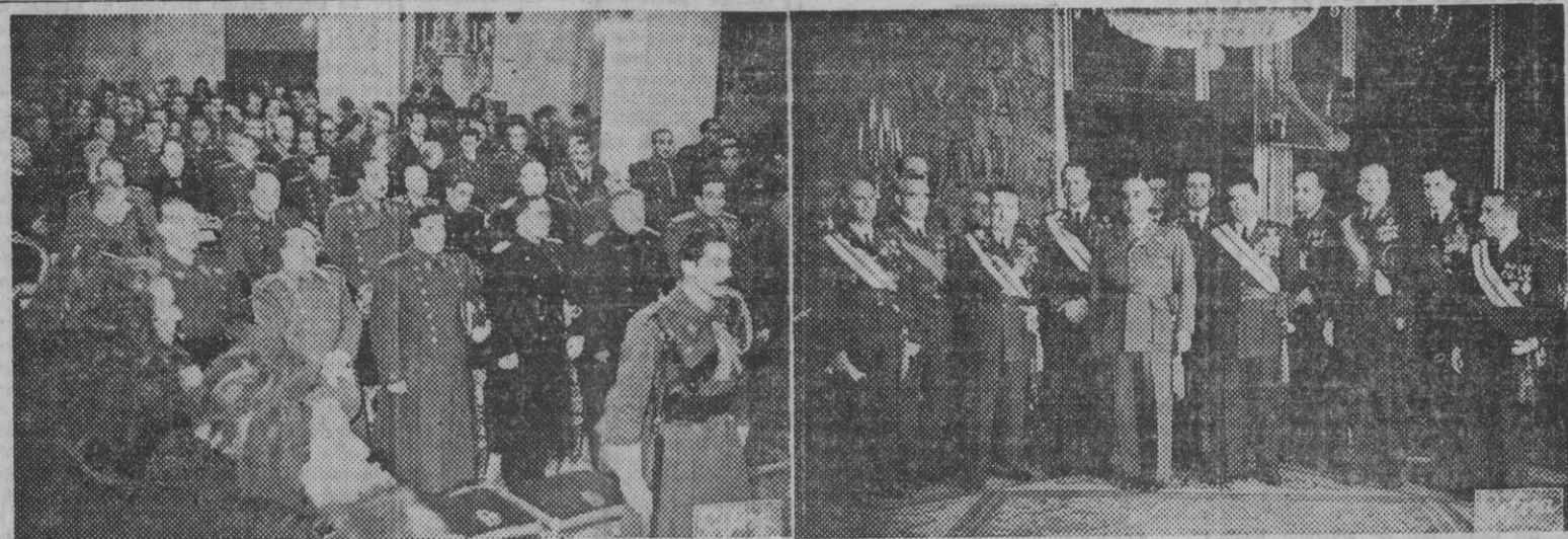
1. El ministro del Aire, con los ministros del Gobierno español que asistieron a la ceremonia religiosa celebrada con motivo de la festividad de la Virgen de Loreto, Patrona de la Aviación española. — 2. S. E. el Jefe del Estado, con el ministro del Aire y altos jefes de la Aviación española, a los que ha recibido en el Palacio de El Pardo, con motivo de dicha festividad. — (Fotos Cifra)