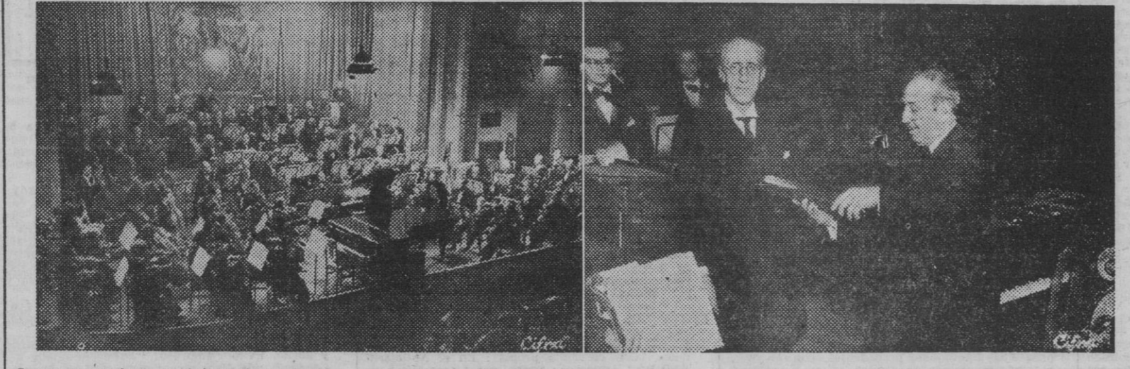
La masa musical que interpretó el concierto en la velada musical de homenaje celebrada en el Monumental Cinema, de Madrid, como homenaje al veterano compositor y director de la Orquesta Sinfónica, don Conrado del Campo. — Momento de la entrega de un obsequio al maestro en dicha velada. — (Fotos Cifra)