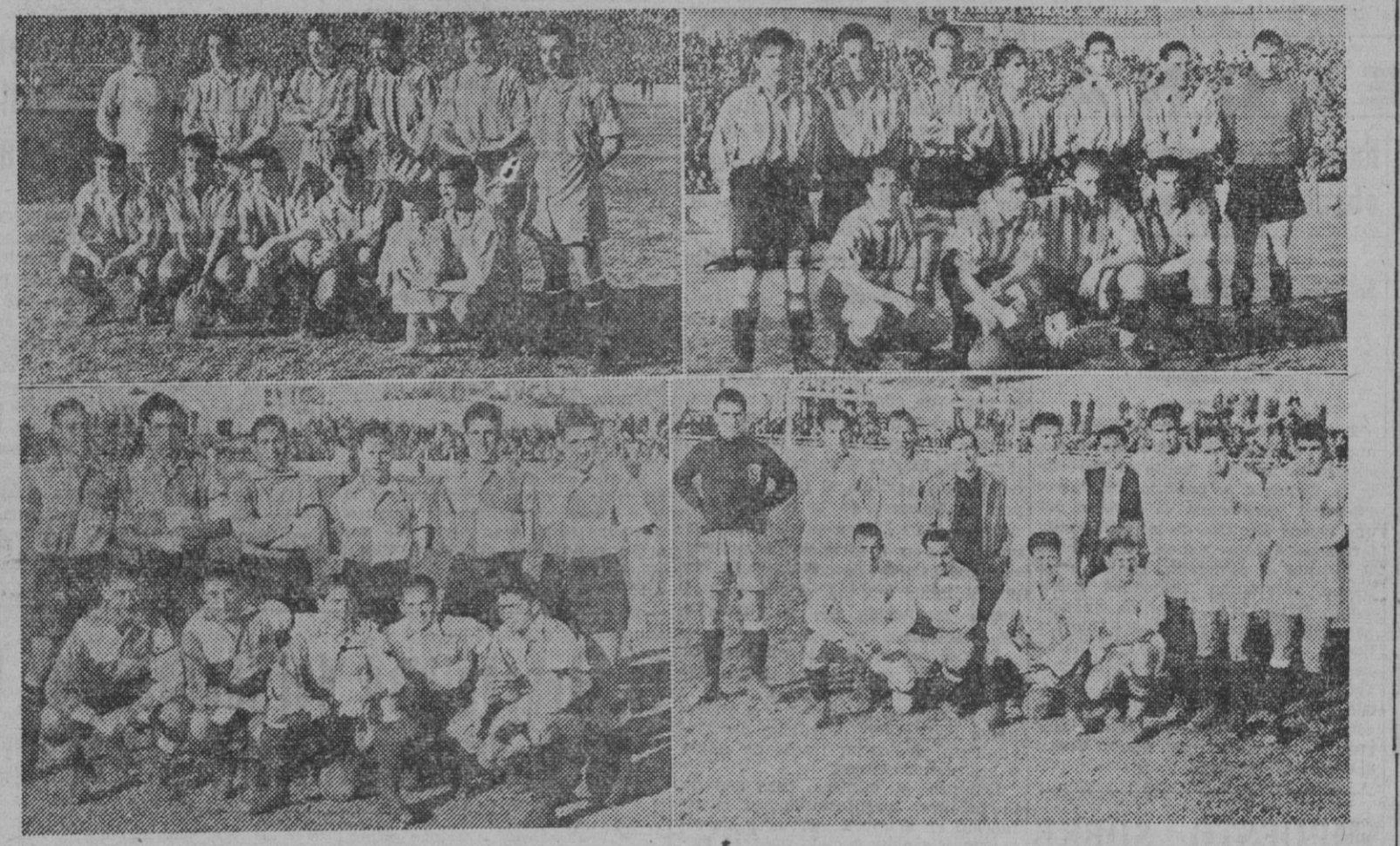
Los equipos del Español-Atlético de Bilbao y Sabadell-Ceuta, que jugaron en Sarría y la Cruz Alta, respectivamente.