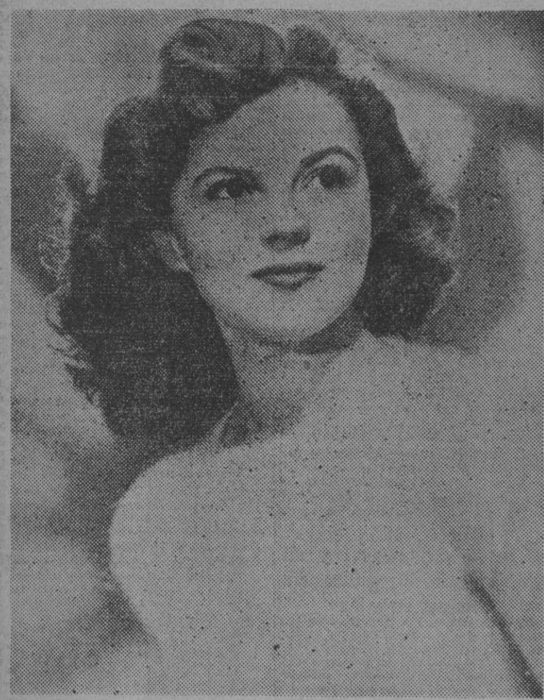
La joven actriz cinematográfica Shirley Temple, acaba de publicar una autobiografía titulada "My Young Life" ("Mi joven vida"), profusamente ilustrada con fotografías.