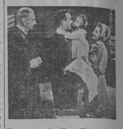
Una escena del film «Un caballero en la noche» que se proyecta con éxito en Fémima