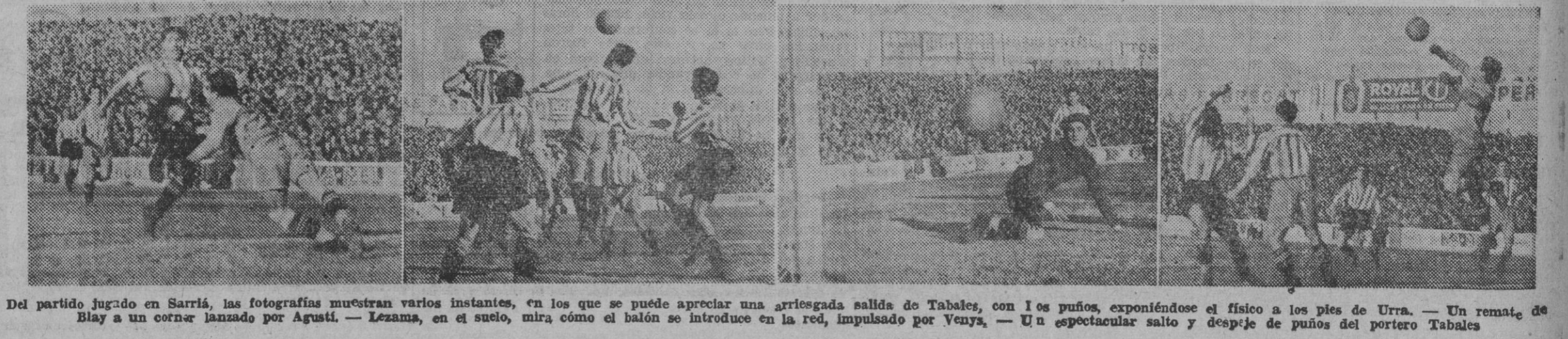
Del partido jugado en Sarría, las fotografías muestran varios instantes, en los que se puede apreciar una arriesgada salida de Tabales, con los puños, exponiéndose el físico a los pies de Urra. — Un remate de Blay a un corner lanzado por Agustí. — Lezama, en el suelo, mira cómo el balón se introduce en la red, impulsado por Venys. — Un espectacular salto y despeje de puños del portero Tabales