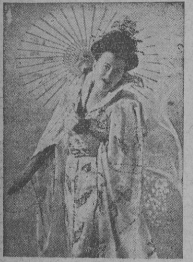
FIGURA DEL TEATRO