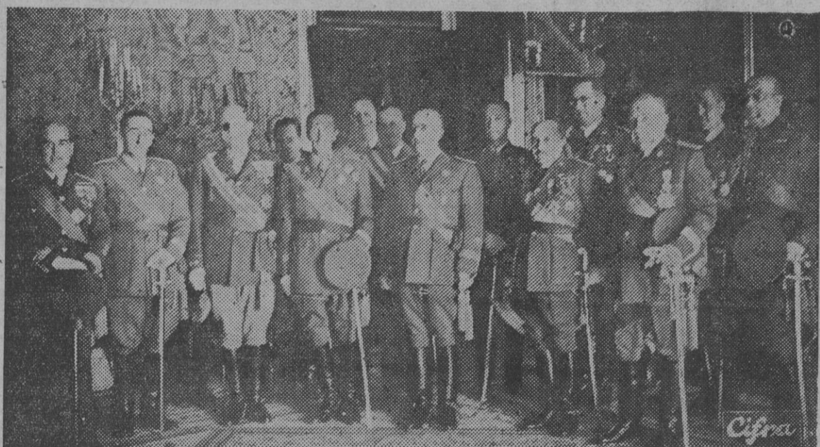
S. E. el Jefe del Estado, con el ministro del Ejército, el capitán general de Madrid y generales con mando en plaza, que acudieron al Palacio de El Pardo para tes timoniarse su adhesión con motivo de la festividad de la Inmaculada, Patrona de la Infantería española.

La fiesta de la Patrona de la Infantería de Madrid