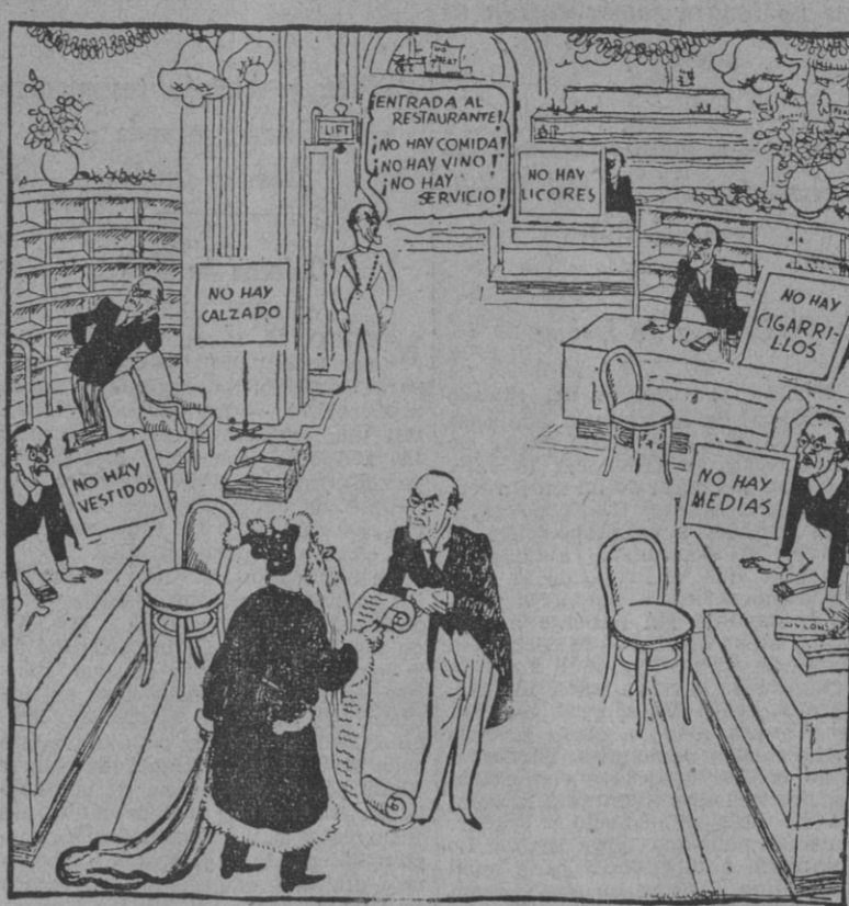
PAPA NOEL COMPRANDO REGALOS DE NAVIDAD Del "Daily Mail", de Londres

WASHINGTON, 10. — El embajador del Irán en esta capital ha manifestado a la Prensa que había presentado en el departamento de Estado una nota relativa a la contestación de Moscú a la petición norteamericana de retirada de todas las fuerzas extranjeras que se encuentran en Persia. "No queremos la dominación rusa o británica en parte alguna de nuestro territorio — dijo el diplomático —; con respecto al problema del Azerbaidjan, deseamos una fórmula de arreglo con Rusia". Al justificar la actitud de su país de no querer hacer concesiones petrolíferas a ninguna nación en tanto las tropas extranjeras no evacúen su territorio, el embajador se refirió "a la actitud que en casos similares eran adoptados los países sudamericanos en cuanto a concesiones internacionales". — Efe.