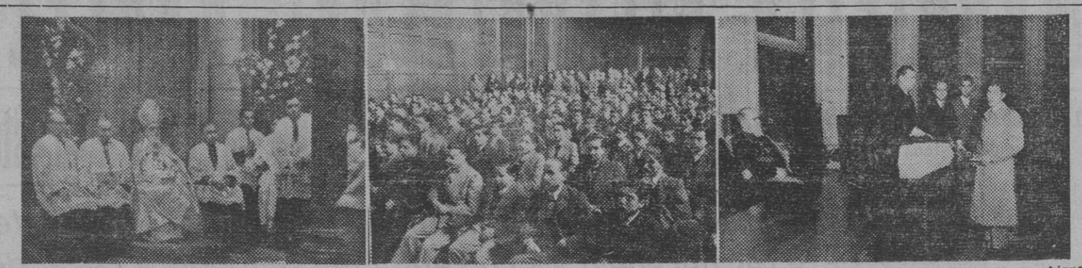
Ayer, domingo, el Gremio de Ultramarinos celebró varios actos en honor de su Patrona, la Inmaculada Concepción. En la primera foto, el obispo de Colofón, que celebró pontifical en la iglesia de la Casa de Caridad. En la segunda, un aspecto de la sala de actos del Fomento del Trabajo Nacional en el acto celebrado por dicho Gremio para hacer en tréga de libretas de ahorro a los dependientes. En la última, el excelentísimo señor gobernador civil hace entrega de las libretas.