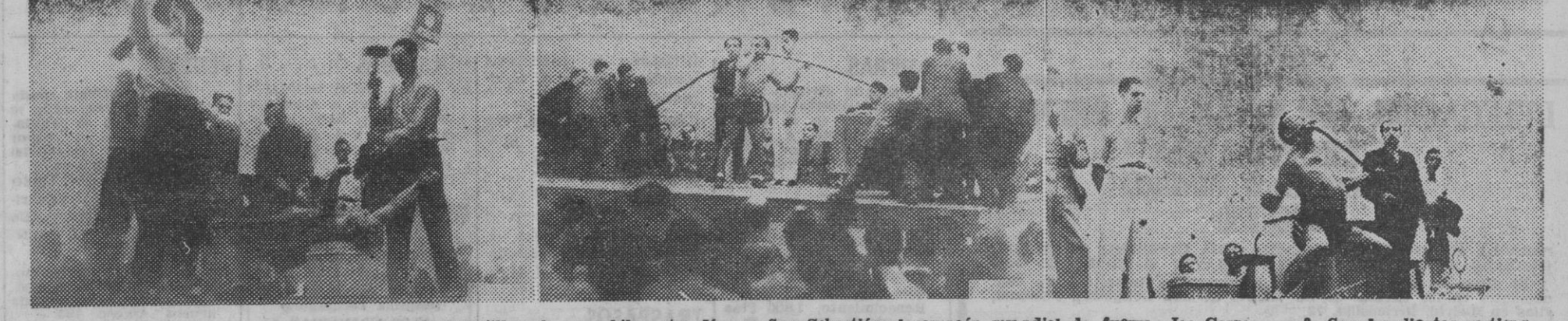
1. Con dos yunques sobre su cuerpo y cinco obreros martillando, se exhibe estos días en San Sebastián el campeón mundial de fuerza, Joe Carson. — 2. Con los dientes sostiene una barra de hierro, mientras seis hombres hacen contrapeso a cada extremo, durante una de dichas exhibiciones. — 3. En uno de sus alardes de fuerza, Joe Carson dobla con los dientes, asombrando a los espectadores, una barra de hierro de dos centímetros de grueso.