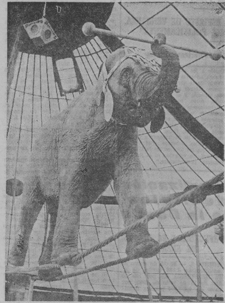
El elefante "Baby", del circo Olimpia, pasa la maroma con asombrosa seguridad