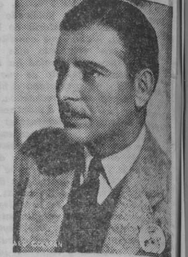
Ronald Colman, que con Ana Lee son las principales figuras del film "Otra vez mía", que mañana se estrena en el Fantasio