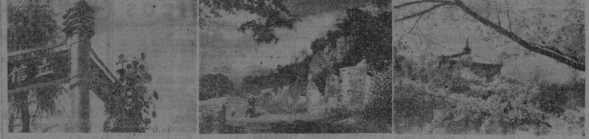
Continúa el avance de las fuerzas rusas a través del Manchukuo, en dirección del mar del Japón. He aquí tres bellas fotografías del territorio alcanzado por las fuerzas soviéticas: la primera es de una quinta particular en las a fueras de Mukden; la segunda, corresponde al castillo de Fusien, y la tercera, a un templo religioso rodeado de árboles en flor.