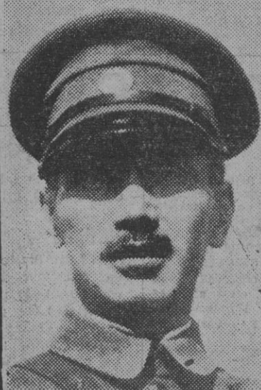
Chiang Kai-Shek, generalísimo chino