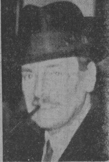
Mr. Clement Attlee, primer ministro británico