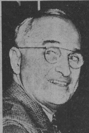
El presidente norteamericano, Harry S. Truman

En tal caso, ¿no hemos de saludar a nuestros súbditos, o hacer expresar ante el espíritu de nuestros antepasados a la población? Por estas razones hemos ordenado la aceptación de la declaración conjunta de los Estados Unidos, Gran Bretaña, la Unión Soviética y China. No podemos sino expresar nuestro más profundo pesar a nuestras naciones aliadas del Pacífico Oriental que han cooperado así en pro del Asia Oriental. Nuestro pensamiento está con los oficiales y soldados, así como con todos aquellos que han caído y los de la pena de sus deudos acorrala nuestro corazón día y noche."