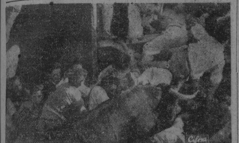
Emocionante fotografía obtenida cuando uno de los toros del "encierro", la típica fiesta de San Fermín, en Pamplona, se encuentra tapada la entrada a la plaza y ha de saltar por encima de los muchachos que se interponen a su paso.