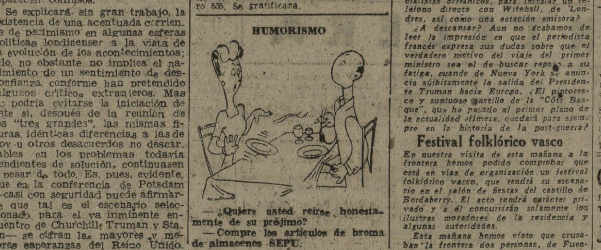
—¿Quiere usted retirarse honestamente de su prójimo? —Compre los artículos de broma de almacenes SEPU.