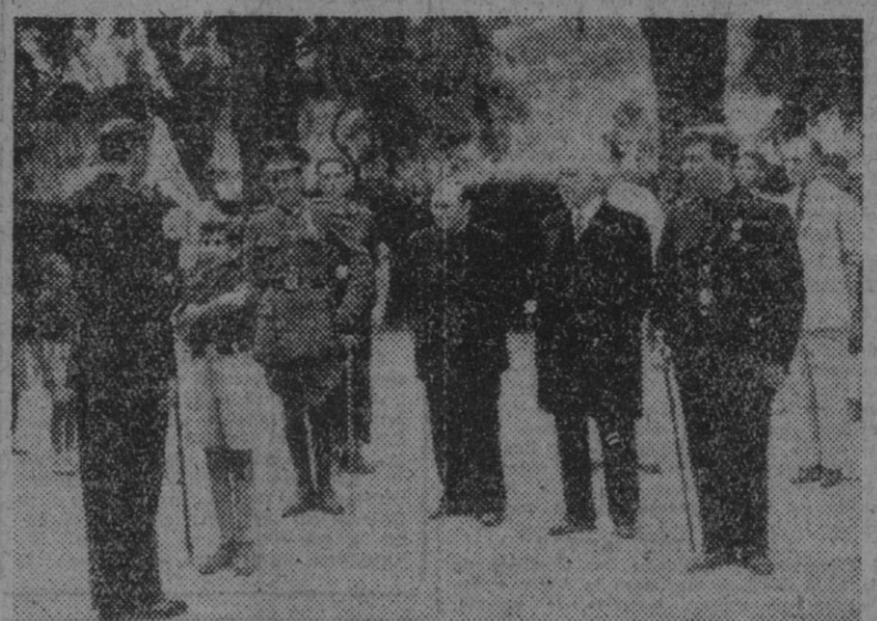
El Excmo. Sr. gobernador civil y jefe provincial del Movimiento, camarada Correa, presidiendo la entrega de un banderín al Frente de Juventudes, en la Estación Prerentorial de Arenys de Mar.