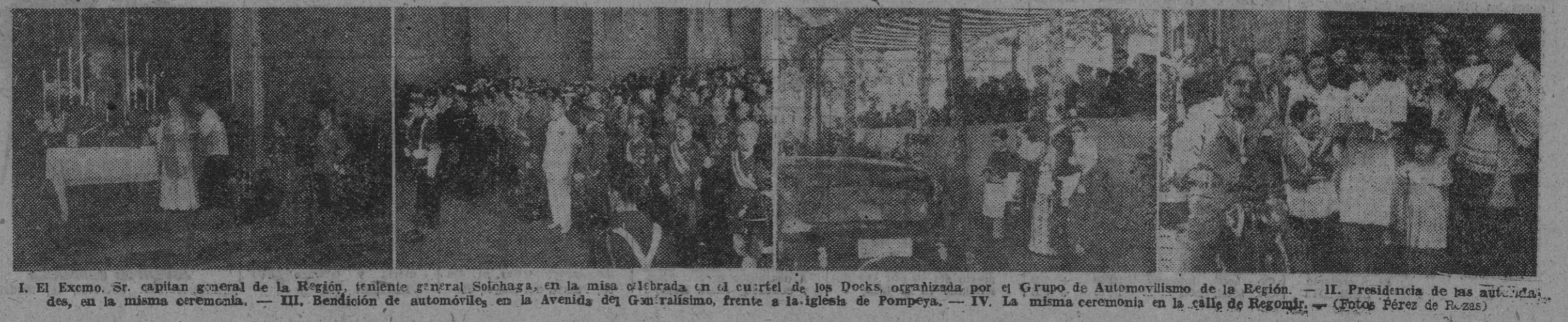
I. El Excmo. Sr. capitán general de la Región, teniente general Solchaga, en la misa celebrada en el cuartel de los Docks, organizada por el Grupo de Automovilismo de la Región. — II. Presidencia de las autoridades, en la misma ceremonia. — III. Bendición de automóviles en la Avenida del Generalísimo, frente a la Iglesia de Pompeya. — IV. La misma ceremonia en la calle de Regomir.